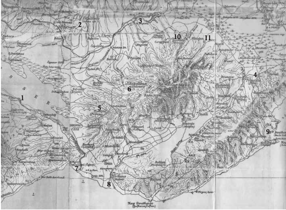
Αυστριακός χάρτης (τέλη 19 ου αι.). Ενδείξεις: 1= Αχινός, 2= Ζίχνη, 3= Γέφυρα Αγγίστας, 4= Πράβι, 5= Προβίστα, 6= Ροδολίβος, 7= Τσάγεζι, 8= Ορφανό, 9= Ελευθερές, 10= Κορμίστα, 11= Νικήσιανη.

Το δρομολόγιο της αρχικής έλευσης μέχρι τη Ζίχνη