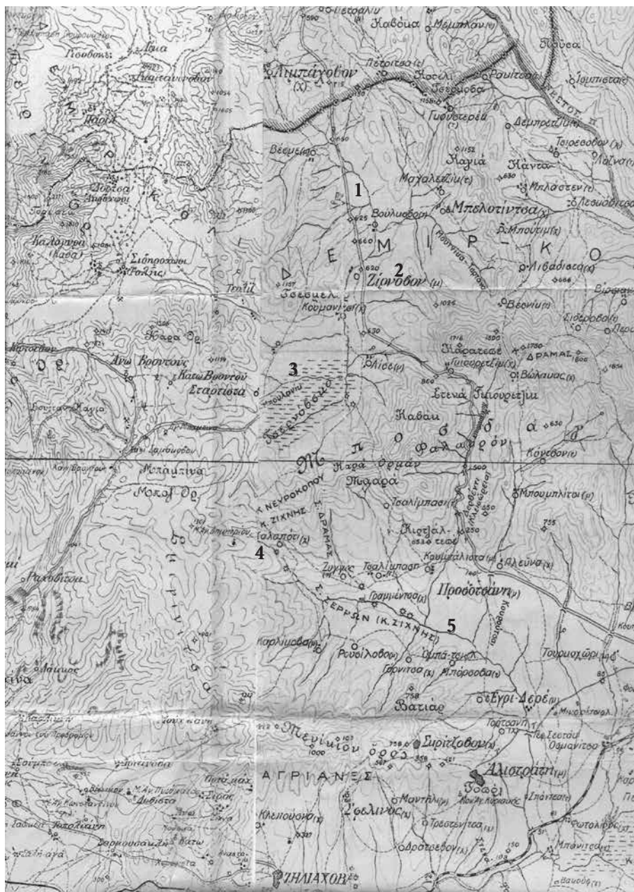
Αυστριακός χάρτης, τέλη 19 ου αι. [εντός ορθογωνικών καμπυλών οι ονομασίες στον χάρτη]. Ενδείξεις: 1 Ποτ. (Ανω) Νευροκόπος [Veznia], 2 Ζήρνοβο [Zernovo], 3 Πλησιονή νερών Κλειστής λεκ. Ζηρνόβου ή Λίσε [Zernovska], 4 Πηγές Μααρά (ή Αγγίτη) [Kalarot], 5 Ποτ. (Κάτω) Νευροκόπος [Lisa Sevindria].