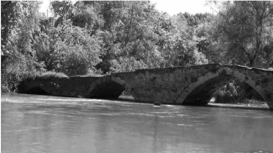
Η Γέφυρα της Αγγίστας ή Πέτρινο Γεφύρι του Αγγίτη.

Με την παραδοχή αυτή «συντάσσεται» και η αναφορά του Βακαλόπουλου ότι από τους άνδρες του Νικοτσάρα που αιχμαλωτίστηκαν «κάποιοι φυλακίστηκαν στο Ροδολίβος και άλλοι στη Δράμα, όπου απαγχονίστηκαν». Διότι, αν δεχθεί κανείς ότι η αποφασιστική μάχη έγινε στην (ανύπαρκτη) γέφυρα «εις Αχινόν χωρίον», γιατί οι αιχμάλωτοι να μεταφερθούν και να απαγχονιστούν στο Ροδολίβος (κοντά στην Ποβίστα) ή στη Δράμα, και όχι στη Νιγρίτα ή στα Σέρρα;