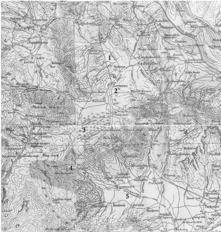
Αυστριακός χάρτης, τέλη 19 ου αι. [εντός ορθογωνικών καμπυλών οι ονομασίες στον χάρτη]. Ενδείξεις: 1 Ποτ. (Άνω) Νευροκόπος [Veznia], 2 Ζήρνοβο [Zernovo], 3 Πλησμονή νερών Κλειστής λεκ. Ζηρνόβου ή Λίσε [Zernovska], 4 Πηγές Μααρά (ή Αγγίτη) [Kalapot], 5 Ποτ. (Κάτω) Νευροκόπος [Lisa Sevindria].

Υπόψη των ανωτέρω, δεν μπορεί να αποκλειστεί το ενδεχόμενο ότι οι καταδρομείς του Νικοτσάρα έκαναν την επίμαχη διαδρομή μέσα στον ασφυκτικό πράγματι χρόνο των περίπου 20 ημερών. Ας κά-