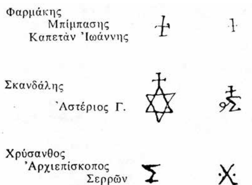
Σύμβολα των Φιλικών Φαρμάκη, Σκανδάλη και μητροπολίτη Σερρών Χρύσανθου από το αρχείο Σέκερη.

Ο Εμμανουήλ Παπάς και η οικογένειά του έδωσε για την Επανάσταση και την ελευθερία του Γένους την ίδια τη ζωή του, θυσιάστηκαν ζωές των παιδιών του και εξανειμίστηκε η ακίνητη και κινητή περιουσία του. Εν τέλει συνειδητοποιούμε ότι έδωσε εδώ και 200 χρόνια, και συνεχίζει να δίνει, την τιμή και αξιοπρέπεια στο όνομα των Σερραίων, σχετικά με τη συμμετοχή τους στην μεγαλειώδη ελληνική επανάσταση του 1821.