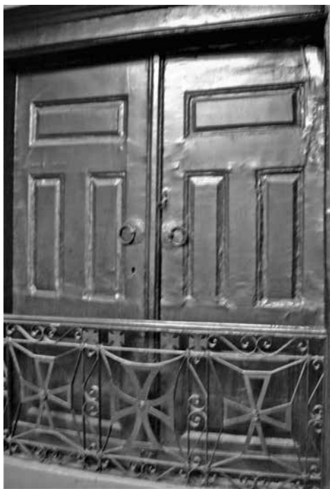
Η πύλη του Οικουμενικού Πατριαρχείου, απαγχονισμού του πατριάρχη Γρηγορίου του Ε΄, κλειστή εδώ και 200 χρόνια.

Οι παραπάνω ενέργειές του είχαν διπλή επιρροή. Από τη μια μεριά, ενίσχυσαν και τόνωσαν την εχθρότητα των Οθωμανών εναντίον των Ελλήνων και έτσι οι Οθωμανικές Αρχές των Σερρών που από καιρό παρακολουθούσαν τις τοπικές κινήσεις των Σερραίων Ελλήνων και ενημερώνονταν για τη γενικότερη επαναστατική διάθεση του έθνους, ετοίμασαν σχέδιο αντίστοιχο με του Σουλτάνου για θανάτωση των «μεγάλων Κοτζιαμπασήδων και του Δεσπότη» 40 , σχέδιο που λίγες μέρες πριν το Πάσχα της 10 Απριλίου 1821 αποκαλύπτει ο Μοστάμπεης (γιος του