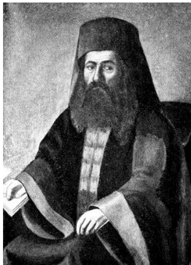
Ο Μητροπολίτης Σερρών Χρύσανθος.

3) Την διαχείριση των οικονομικών μέσων που συνέλεγε από τους ομογενείς για τον επαναστατικό αγώνα. Χαρακτηριστικό παράδειγμα αποτελεί η οικονομική ενίσχυση του Παπά, που έστειλε από την Κωνσταντινούπολη την ημέρα της επίσημης μνησέως του [21 Δεκεμβρίου 1819] προς τον Χρύσανθο. Σε σχετική επιστολή ο Παπάς αλληγορικά αναφέρει ότι δίνει τα χρήματα για την Σχολή του Πανελληνίου (δηλ. την οργάνωση του αγώνα της Επανάστασης) και πιο συγκεκριμένα: «Περί πλέον ο πατριωτισμός με υπαγορεύει να ενθυμηθώ και την δημιουργουμένην και μάλλον ήδη ενεργουμένην Σχολήν της Πατρίδος· διό και προσφέρω κατά το παρόν διά χειρός του Κωνσταντίνου Παπαδάτου γρόσια χίλια (No 1.000), ως προοφειλομένην συνδρομήν βοηθητικήν προς αυτήν, και ότε τύχη αγαθή βεβαιωθώ εις την μείζονα αποκατάστασιν και εκτέλεσιν αυτής της Σχολής του Πανελληνίου, υπόσχομαι το κατά δύναμιν όλην να συνεισφέρω, προς καταρτισμόν αυτής» 14 .