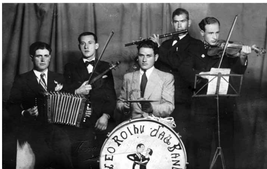
Σερριώτικη μπάντα Ελαφράς μουσικής κατά τα πρώτα χρόνια της μεταπολεμικής περιόδου.