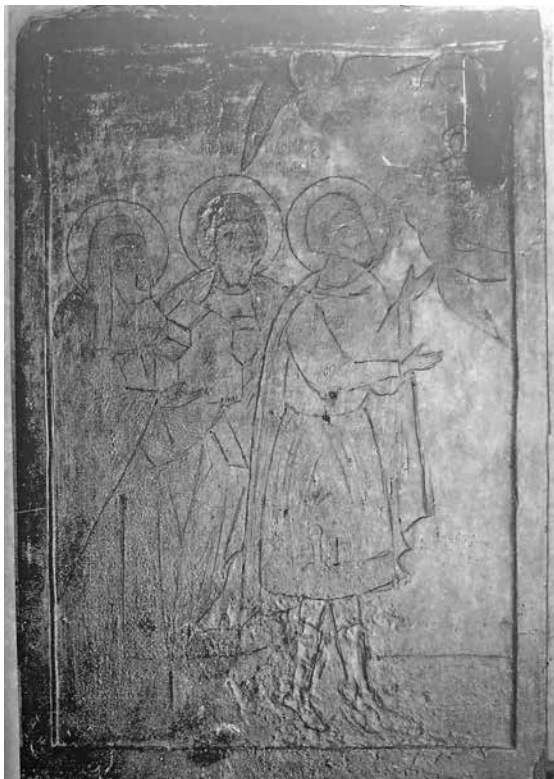
Εικ. 7. Η εικόνα της φωτογραφίας ΧΑΕ 3384 γραφιστικά τροποποιημένη με τονισμένες τις λεπτομέρειες των μορφών.

Ήταν μια σκαφωτή εικόνα με αυτόξυλο πλαίσιο, που αποτελούνταν από δύο τουλάχιστον ενωμένες ξύλινες σανίδες. Ο κάμπος της εικόνας ήταν πιθανότατα χρυσός. Ο Π. Παπαγεωργίου αναφέρει ότι το φωτοστέφανο του Γενναδίου ήταν αργυρό. Στη φωτογραφία όμως δεν φαί-