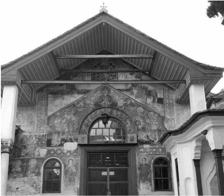
Εικ. 1. Η πρόσοψη της Τράπεζας της Ι. Μ. Μεγίστης Λαύρας με την κτητορική παράσταση.