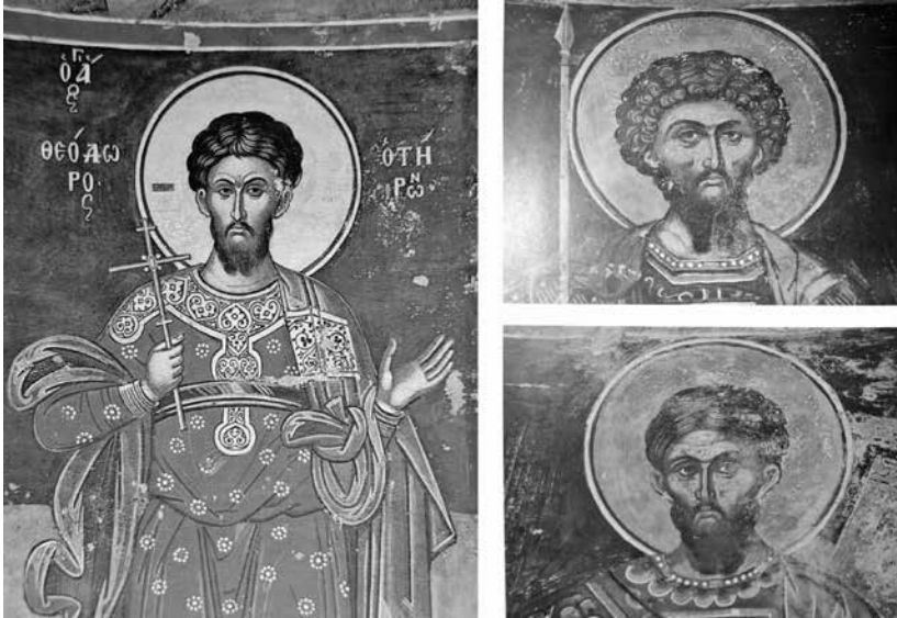
Εικ. 3. Αριστερά ο άγιος Θεόδωρος ο Τήρωνας, Καθολικό Ι.Μ. Διονυσίου. Δεξιά οι άγιοι Θεόδωροι Στρατηλάτης και Τήρωνας, κελί Μολυβοκκλησιάς (Σ. Θ. Παντζαρίδης).