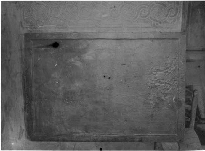
ΣΕΡΡΑΙ. Μητροπολιτικός ναός Αγίων Θεοδώρων. Εικόνα αγίου Θεοδώρου.

Για να μελετηθεί η εικόνα, η φωτογραφία επεξεργάστηκε ψηφιακά σε υπολογιστή. Πρώτα, από τον γράφοντα, η φωτογραφία γυρίστηκε