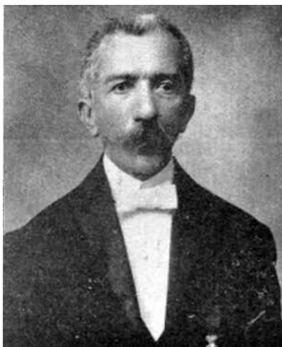
Ο καθηγητής Κλεάνθης Αιγιαλείδης.