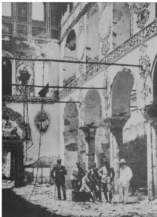
Εικ. 4. το συνεργείο κτηματογράφησης του Krafft στον ναό Αγίων Θεοδώρων Σερρών (Ιούλιος-Αύγουστος 1914).