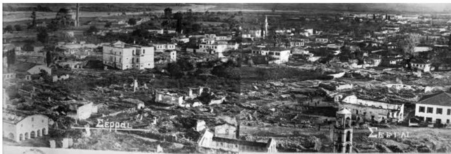
Εικ. 1. Συλλογή Μουσικού Αρχείου Γ. Αγγειοπλάστη, μερική άποψη Σερρών (Krafft, 1914).

Στην παρούσα μελέτη έγινε αναψηλάφηση του ιστορικού δημιουργίας του πλέον αναγνωρίσιμου φωτογραφικού πανοράματος των Σερρών από τον γερμανό μηχανικό Krafft 28 μετά τη μεγάλη πυρκαγιά των Σερρών το 1913, η οποία αποτελεί έναν από τους σημαντικότερους σταθμούς της ιστορίας της πόλης διαχρονικά. Οι λήψεις του Krafft αποτελούν φωτογραφικό τεκμήριο και αφετηρία μελέτης μνημείων βυζαντινών, μεταβυζαντινών και νεότερων χρόνων, η διερεύνηση των οποίων αναμένεται να αποδώσει πλήθος στοιχείων.