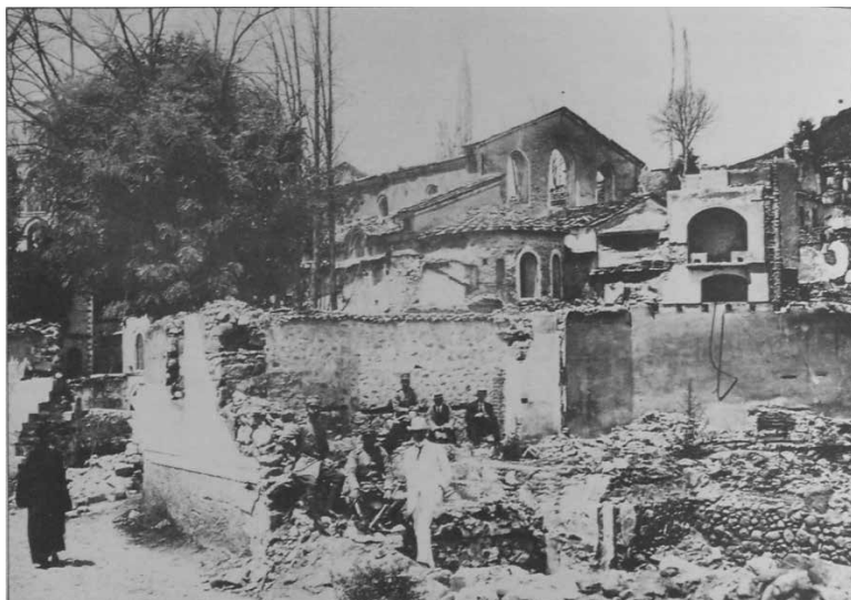
Εικ. 3. το συνεργείο κτηματογράφησης του Krafft στις Σέρρες (Ιούλιος-Αύγουστος 1914).