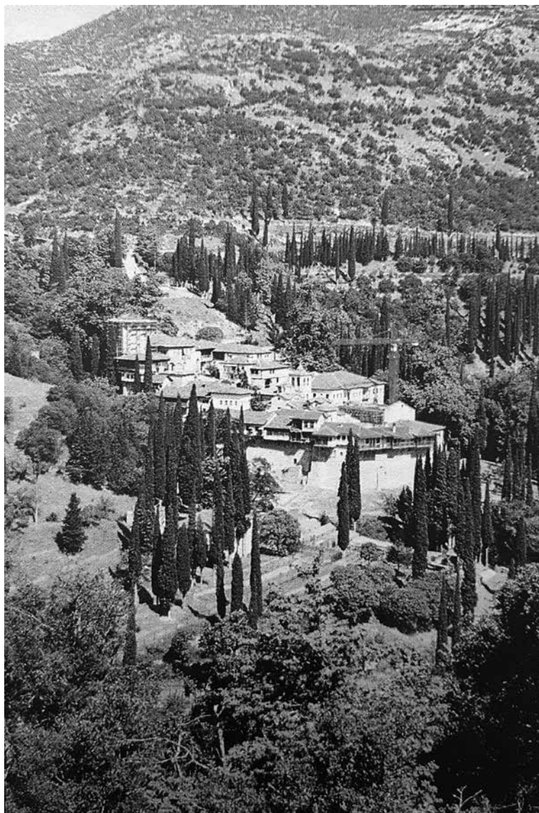
Άποψη της Ιεράς Μονής Τιμίου Προδρόμου Σερών.