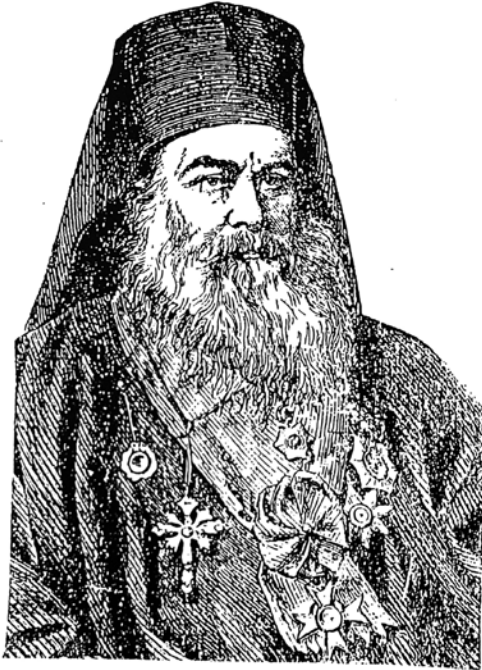
ΙΑΚΩΒΟΣ ΚΑΣΑΝΔΡΕΙΑΣ (ξυλογραφία τοῦ 1863)

Μετὰ νοημοσύνης καὶ διοικητικῆς συνέσεως εἰργάσθη καὶ Ἰάκωβος ὁ μητροπολίτης Κασανδρείας, (εἶτα Σερρών, καὶ τέλος πατριάρχ-