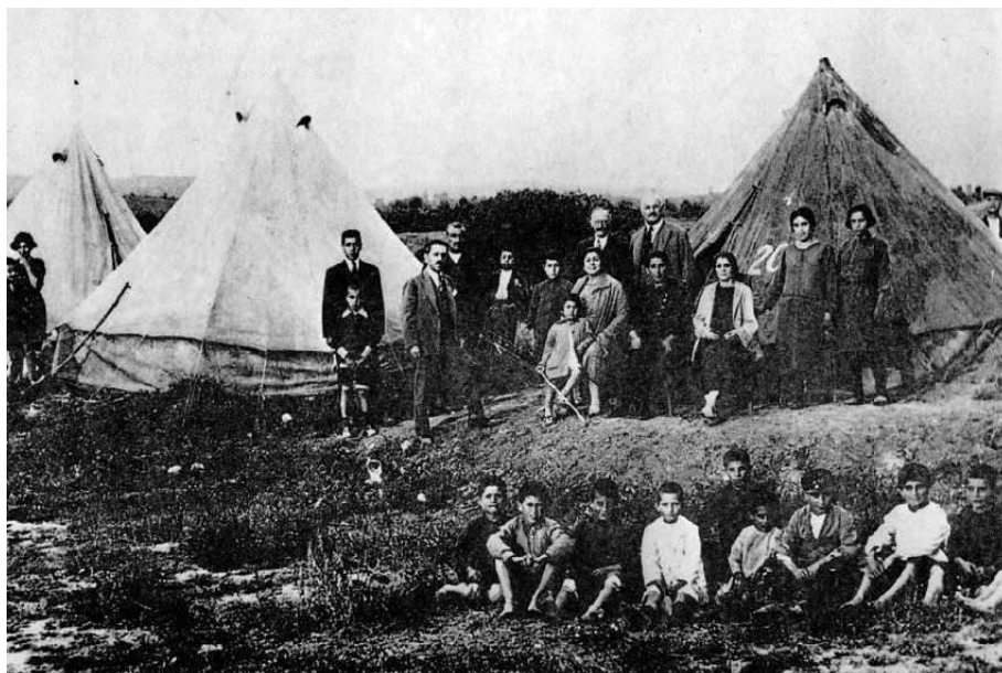
Σκηνές αγροτικής εγκατάστασης προσφύγων.

λοκληρώθηκε έως τις αρχές του 1921. «Πολυάριθμοι Έλληνες αφίκοντο εκ Καρς εις Βατούμ. Και εκ της περιοχής Αρδαχάν ανεχώρησαν 10.000 Έλληνες κατευθυνόμενοι εις Βατούμ» (Μακεδονία, 8/12/1920). Ο συνολικός αριθμός των «εν Αντικαυκάσω Ελληνικών πληθυσμών» που κατέφυγαν στη Θεσσαλονίκη από το Μάιο του 1920 ως το τέλος Φεβρουαρίου 1921 ήταν 52.878, κατά τον Αιλιανό (σ. 59). Ο Αιλιανός περιγράφει επίσης 32 τα προβλήματα που αντιμετώπισαν οι Καυκάσιοι και τις προσπάθειες της Ελλάδας για την προστασία, μεταφορά και τελική εγκατάστασή τους. Η κατάσταση που επικρατούσε στα καράβια των προσφύγων και η ψυχολογική κατάσταση περιγράφεται υπηρεσιακά: «Η πολυήμερος διαμονή των προσφύγων επί των ατμοπλοίων, ο συνωστισμός και η ναυτίασις, προσθέτως δε και η ψυχολογική διάθεσις και τα ηθικά βάσανα του αιφνιδίου αποχωρισμού από των οικείων και της εγκαταλείψεως περιουσιών [...] επέδρασαν επί της υγείας των προσφύγων» 33 , αλλά και σε πολλές περιγραφές προσφύγων.