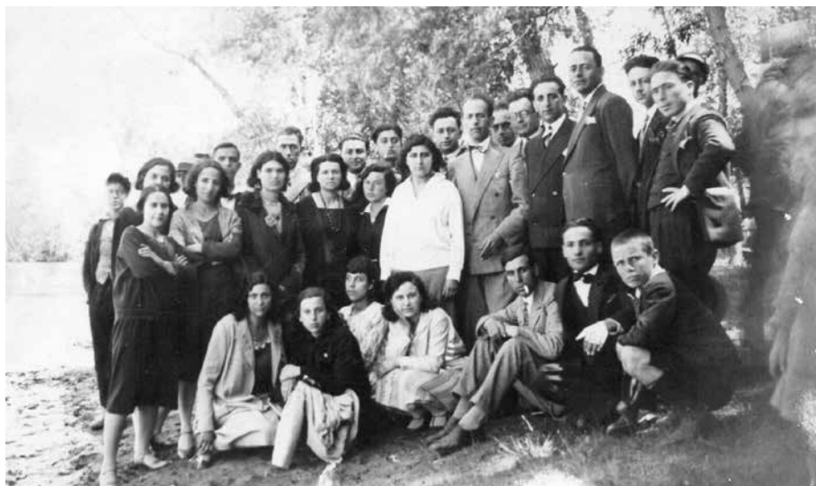
Πρωτομαγιά στην Αγγίστα, 1930.