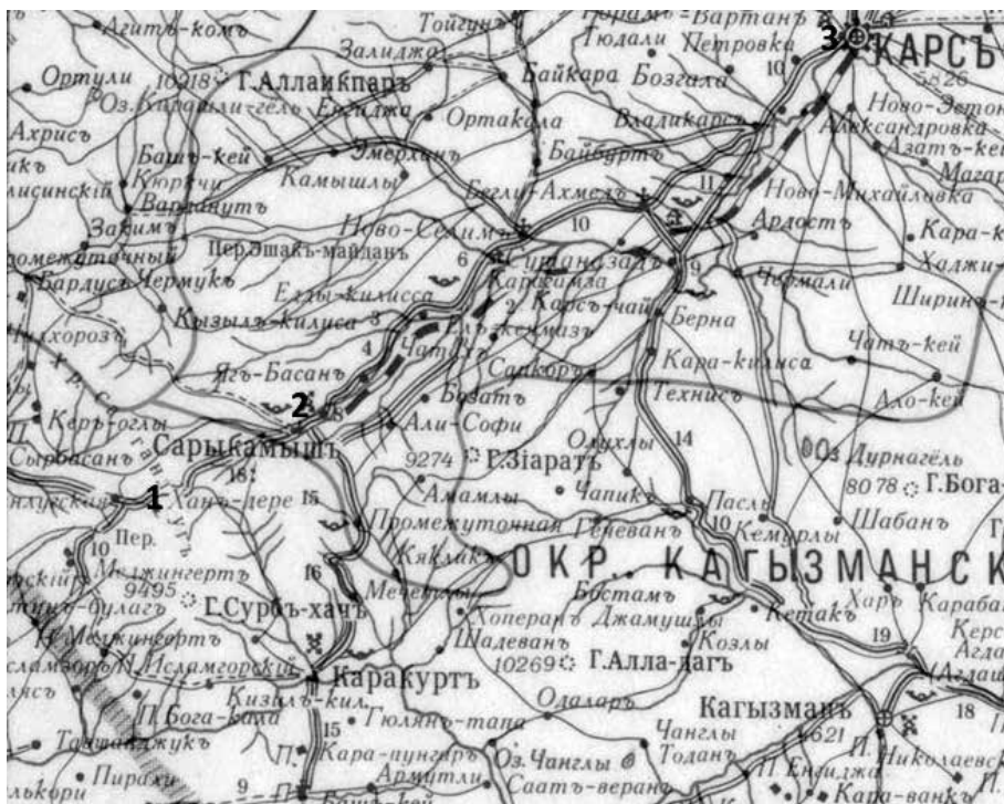
Λεπτομέρεια από ρωσικό χάρτη του Καυκάσου, 1903: 1. Χάντερε, 2. Σαρήκαμυς, 3. Καρς.

Τα προβλήματα που αντιμετώπισαν οι ελληνικές κοινότητες του Καυκάσου από το 1917 περιγράφονται πολύ γλαφυρά σε επιστολή των κατοίκων της Κοινότητας Χάνδере: «νυν δε αφού από τετραετίας ήδη Ρωσικά στρατεύματα μένουσι παρ' ημίν και εντός των κατοικιών ημών και μάλιστα κατήνησαν ανυπόφοροι διά των παντοειδών ύβρεων, απειλών αυτών προς ημάς τε και τα γυναικόπαιδα δεν δυνάμεθα ούτε εν λεπτόν να μείνομεν εις τον επί γης Άδην. Αι πλείσται των οικογενειών προ τινών ετών μετηνάστευσαν προς την μητέρα Ελλάδα προς εγκατάστασιν εκεί, ηναγκάσθησαν όμως δυστυχώς να επανακάμψουν. Ένεκα λοιπόν της τοιαύτης καταστάσεως της Κοινότητος ημών δεν δυνάμεθα πλέον να ζήσωμεν εν τόπω τούτω και εξαιτούμεθα την αποκατάστασιν ημών εις άλλο μέρος. Ημείς δεν επιζητούμεν υποστήριξιν εις επιχειρήσεις εμπορικής διά να θησαυρίσωμεν εαυτοίς και τοις τέκνοις ημών. Δεν επιζητούμεν μέγαρα και παραδείσους. Είμεθα εθισμένοι εις την σκληραγωγίαν και εις το να κερδιζώμεν εν ιδρώτι του προσώπου ημών εργαζόμενοι τον άρτον [...] να ενεργήση το Κεντρ. Συμβούλιον και να υποδείξη αυτή άλλο μέρος προς μετοικησίαν» (4/12/1917), (Θ.