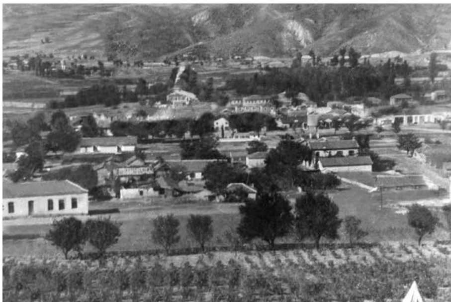
Σταθμός Αγγίστας Σερρών.

Υφαντιδαίοι και άλλοι». Όπως θα φανεί παρακάτω, η αναλογία που δίνει ο Λαυρεντίδης (3/4 Καυκάσιοι) είναι σωστή.