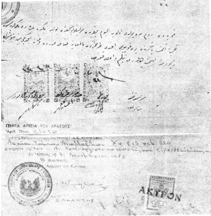
Φωτοτυπία από το πρωτότυπο τουρκικό πιστοποιητικό του θανάτου του Προκοπίου Ικονίου, που είναι γραμμένο στην αραβική.

με τον Μ. Θαβωρίτη ότι δηλητηριάστηκε με καφέ από τους Τούρκους 20 . Κατά τον Σ. Καργάκο «τον έσφαξαν» 21 , κατά τον Ρεθύμνης Ανθιμο, «πέθανε από τα βασανιστήρια στις φυλακές» 22 κ.ά. Η αλήθεια είναι ότι ο Προκόπιος Ικονίου υπέκυψε από καρδιακό νόσημα στη Μονή του Τιμίου Προδρόμου στο Ζιντζίντερε. Το πιστοποιητικό του θανάτου του σώζεται στο Αρχείο Ταμείου Ανταλλαξίμων, Κωδ. 215, σ. 224, του οποίου παραθέτω φωτοτυπία του τουρκικού πρωτοτύπου σε αραβική γραφή καθώς και την επίσημη μετάφραση του ιατρικού πιστοποιητικού