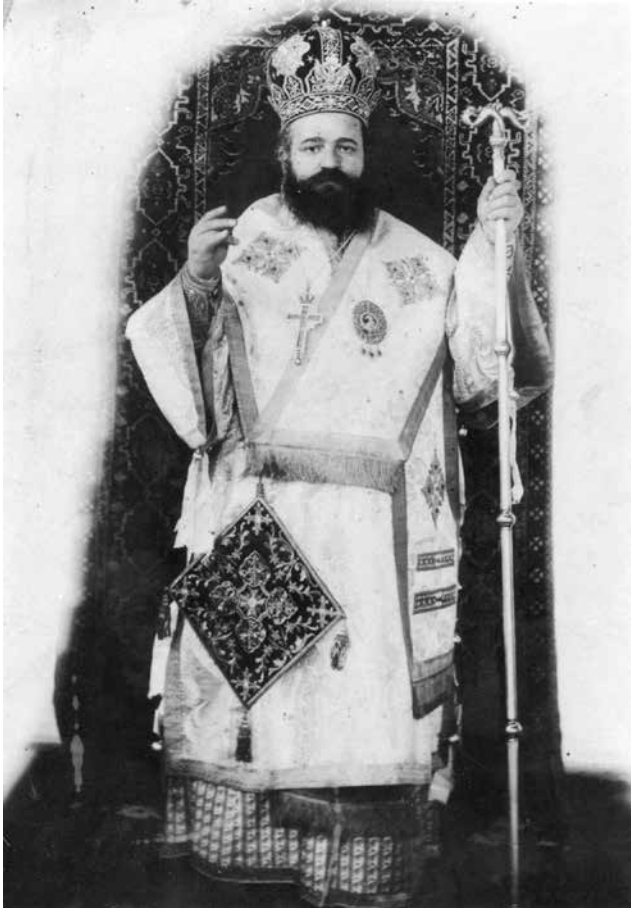
Ο Άγιος εθνοϊερομάρτυρας Μητροπολίτης Προκόπιος Ικονίου (1859-1923).

κληρικό, που γρήγορα κέρδισε την συμπάθεια των Μελενικίων, κυρίως στις συνελεύσεις των εφοροεπιτροπών του κοινού και των εκπαιδευτηρίων. Η ενεργοποίηση του Προκοπίου Λαζαρίδη ως ιεροκήρυκα της μητρόπολης Μελενίκου, ικανοποίησε το χριστιανικό πληθυσμό της περιοχής, που όπως φαίνεται από ευχαριστήριες επιστολές του προς το μητροπολίτη Μελενίκου, είχε στερηθεί για πολλά χρόνια το κήρυγμα του Θεϊνού Λόγου. Σε ευχαριστήριο της κοινότητας Πετριτσίου αποκαλύπτεται η κηρυκτική ικανότητα του Λαζαρίδη και ο άριστος χειρισμός από μέρους του της τουρκικής γλώσσας, την οποία πολλές φορές χρησιμοποιούσε για να γίνεται αντιληπτός από το σύνολο του πληθυσμού. Την ίδια ικανοποίηση εξέφρασε με επιστολή της και η κοινότητα της Κάτω Τζουμαγιάς προς το μητροπολίτη Μελενίκου