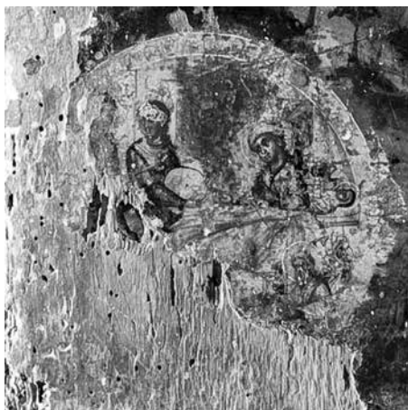
Εικ. 3. Το μετάλλιο με θέμα «Το Γενέθλιον του Προδρόμου».