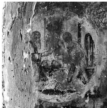
Εικ. 4. Το μετάλλιο με θέμα «Η Εύρεση της κεφαλής του Προδρόμου».

υπάρχουν ζωγραφισμένα δύο αφηγηματικά μετάλλια (τόντο) με σκηνές του βιογραφικού κύκλου του Αγίου. Στο κάτω μετάλλιο απεικονίζεται το Γενέθλιον του Προδρόμου 6 , ενώ στο επάνω μετάλλιο απεικονίζεται σκηνή