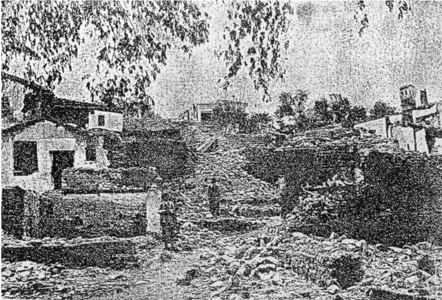
Ερείπια των καταστροφών στην Αλιστράτη.

ΔΙΣ/ΓΕΣ: Επίτομη ιστορία των Βαλκανικών Πολέμων 1912-1913 , Αθήνα 1987.