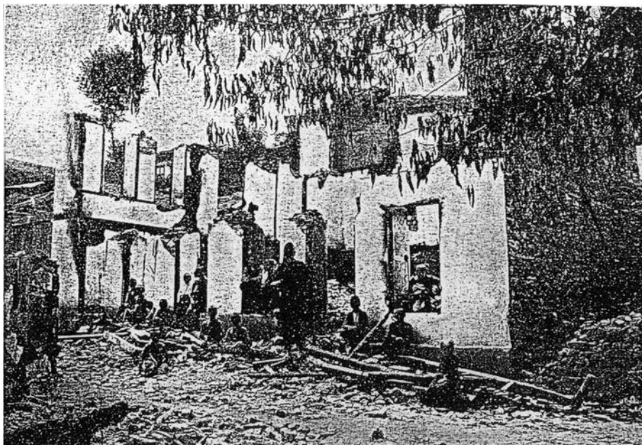
Ερείπια από την καταστροφή της Αλιστράτης.