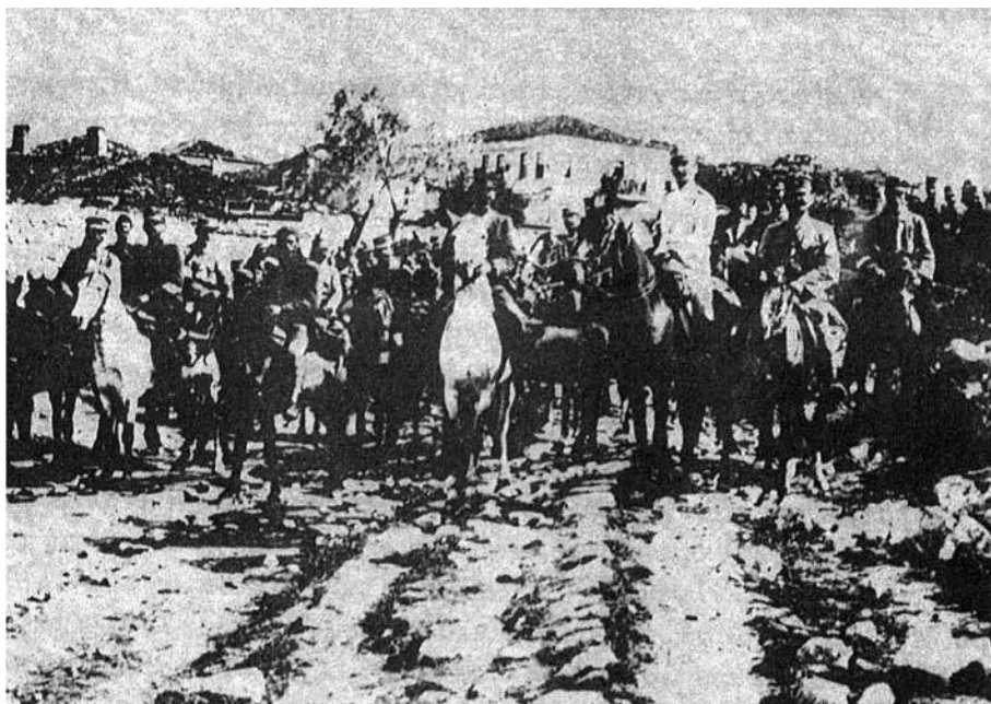
Πρόσκοποι απελευθερώνουν την Αλιστράτη.

Αδιαφορώντας για τα ερείπια, για την πλήρη καταστροφή, την οικονομική τους συντριβή και εξουθένωση, ανέστιοι πια και εξαντλημένοι από την πείνα και την πορεία της εξόδου και της επιστροφής, δέχθηκαν την 4 η Ιουλίου του 1913 τα ευλογημένα παιδιά της Ελλάδος στους δρόμους της καιόμενης κωμόπολης σε μια αποθεωτική Εθνική έξαρση και με ένα άνευ προηγουμένου πατριωτικό παραλήρημα.