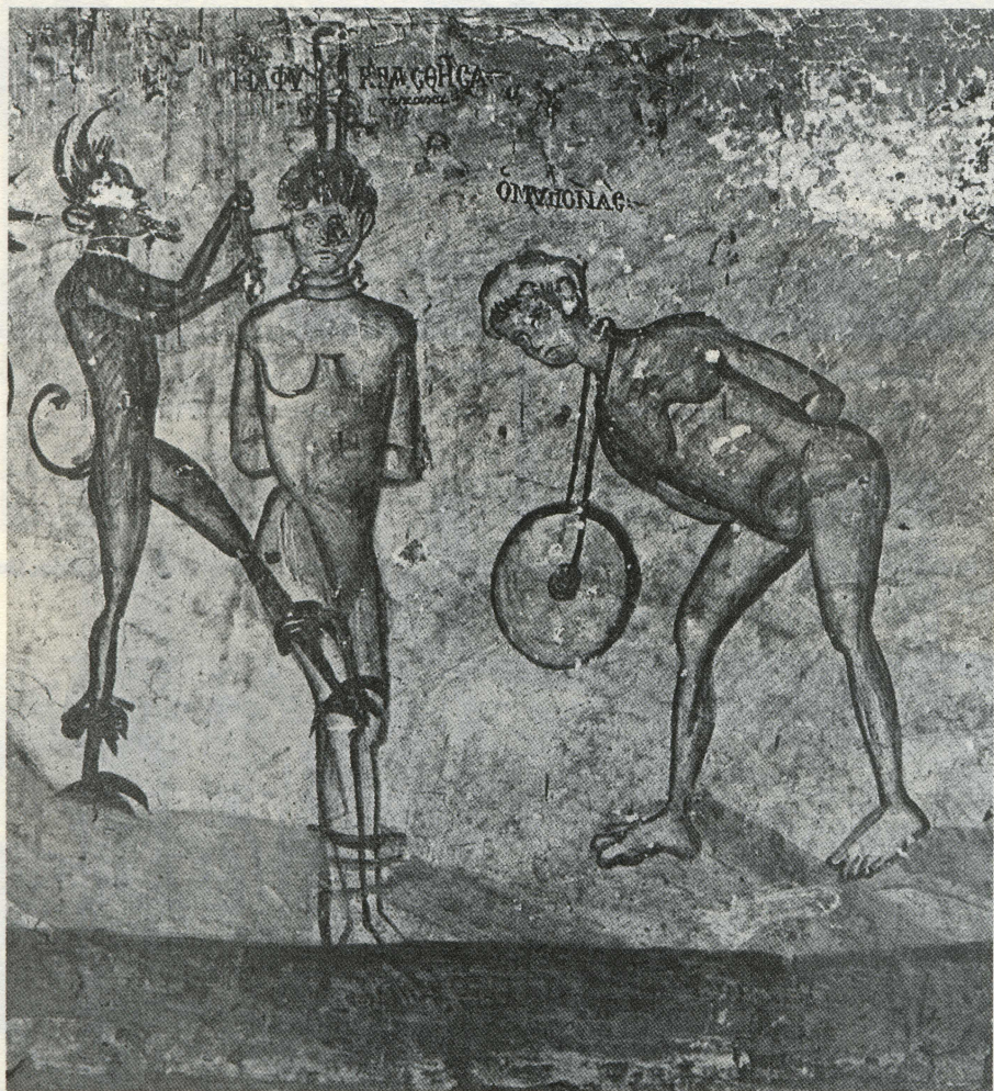
Εικ. 5. εστορίσαμε [...] τον μυλωνά οπού κλέπτει αλεύρι [...] και όποιος παραφηκρέται (Κουτλ. 153, φ 188 β ). Παραστάσεις κολασμένων (Η ΑΦΥΚΡΑΘΗΣΑ τὰ κακά. Ο ΜΥΛΟΝΑΣ) σε τοιχογραφία του Αγίου Ιωάννου του Προδρόμου Καστοριάς (1727) (Πηγή: Ιστορία του Ελληνικού Έθνους , τ. ΙΑ', <Αθήνα>, Εκδοτική Αθηνών, <1975>, σ. 252· πρβλ. Α.Κ. Ορλάνδος, «Τα βυζαντινά μνημεία της Καστοριάς», ΑΒΜΕ 4, 1938, 178).