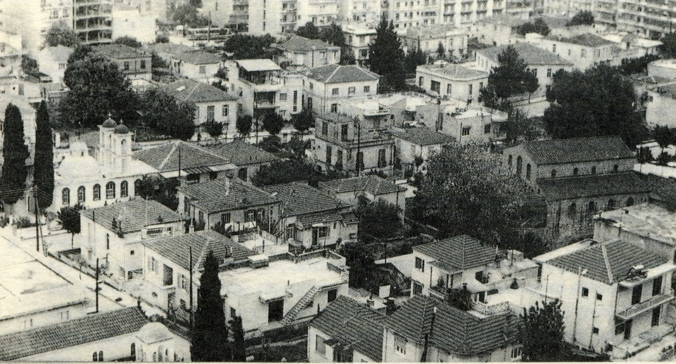
Εικ. 1. Άποψη της Αγίας Παρασκευής σε πρόσφατη εποχή (φωτογρ. 1982). Δεξιά η Παλιά Μητρόπολη.