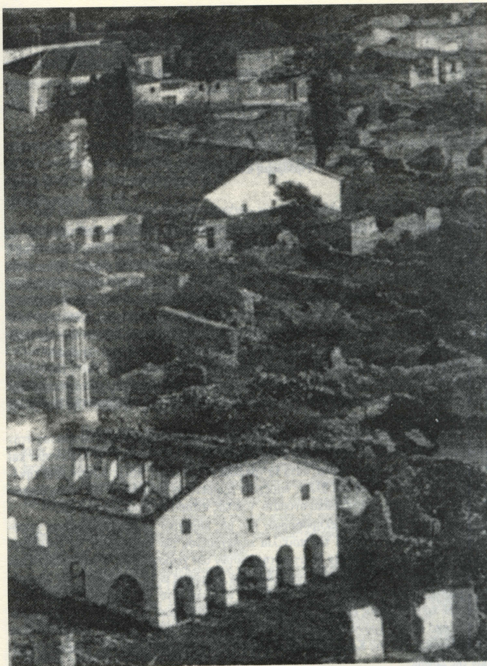
Εικ. 6. Άποψη της Αγίας Παρασκευής μετά τον εμπρησμό της το 1913 σε λεπτομέρεια φωτογραφικής κάρτας εκδομένης λίγα χρόνια μετά. Στο βάθος ο ναός του Αγίου Αντωνίου και της Αγίας Μαρίας (Πηγή: Γ. Καφταντζής, Ορφείας [βλ. σημ. 43]).

Εκείνος ότι το άρχαιότ' ἄσπετον του θεοῦ καὶ γέρας ἐστὶν σφραγὶς καὶ ἡ περιτομὴν κτείνων, τὸ ὄσκιον ἀρτίονα μὴ σφραγίσει τὴν πόλιν Πρωτόργου.