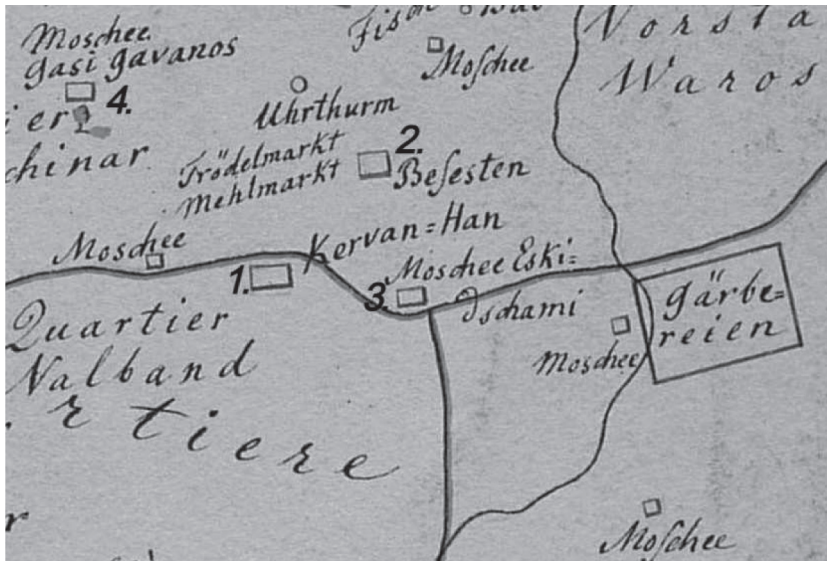
Εικόνα 1. Λεπτομέρεια αποσπάσματος χάρτη της πόλης των Σερρών του Wilhelm von Chabert. Χρονολογία: 1832. Αριθμός 1. Περίγραμμα κτηρίου του Κερβανιού. Αριθμός 2. Το Μπεζεστένι. Αριθμός 3. Το Εσκι Τζαμί. Αριθμός 4. Το τζαμί του Γαζί Εβρενός.