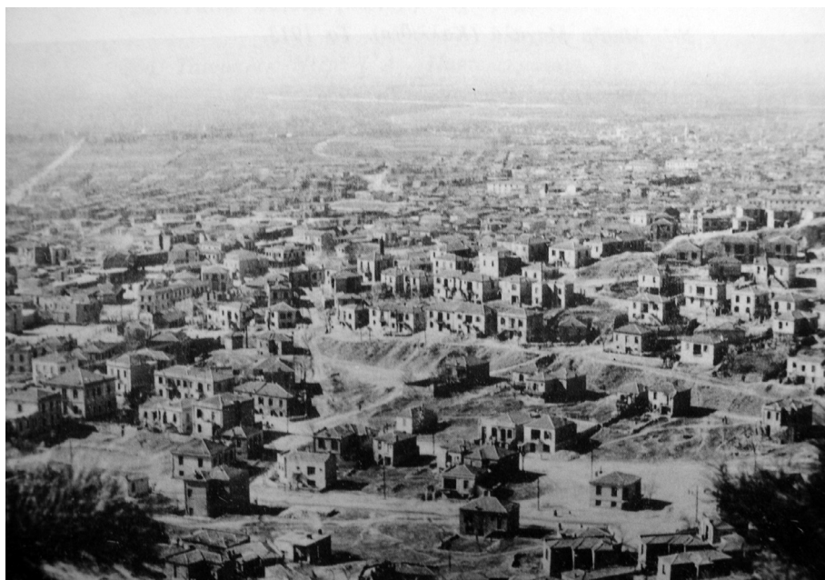
Προσφυγικά σπίτια του προσφυγικού συνοικισμού Μπαϊρ Μαχαλά.