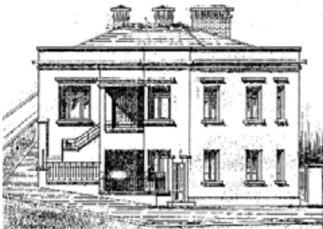
Σχέδιο κατοικίας προσφυγικού συνοικισμού Μπαϊρ Μαχαλά (αρχιτέκτων Ιωάννης Δημητριάδης).

Οι πρόσφυγες εγκαταστάθηκαν μέσω κρατικής πρωτοβουλίας στην τότε περιφέρεια της πόλης των Σερρών. Σήμερα, η πόλη καθώς επεκτάθηκε, ήρθε και αγκάλιασε τα «Νέα Κιουπλιά», τους «Αγίους Αναργύρους», τον «Αστικοσηροτροφικό» και τους άλλους προσφυγικούς συνοικισμούς. Από την περιφέρεια της πόλης οι πρόσφυγες έχοντας συνοχή, πολιτιστική και κοινωνική δυναμική εντάχθηκαν στην πόλη και την κοινωνία της, ούτως ώστε σήμερα στους νεώτερους η φράση «αστικός προσφυγικός συνοικισμός» να μη μπορεί να συνδεθεί με συγκεκριμένες οπτικές και κοινωνικές προσλαμβάνουσες παραστάσεις. Ιδιαίτερα οι συνοικισμοί Νέας Ιωνίας και Αστικοσηροτροφικός, με την κατακόρυφη αύξηση του όγκου δόμησης τα τελευταία χρόνια, πάνω σ' έναν πολεοδομικό ιστό φτιαγμένο με άλλα κριτήρια, με μικρά και πυκνά οικοδομικά πολύγωνα, μικρά οικόπεδα και στενούς δρόμους, έχουν κυριολεκτικά μεταμορφωθεί. Μέσα σε λιγότερο από ογδόντα χρόνια, το ανεπανάληπτο επίτευγμα της στέγασης των προσφύγων φαντάζει πολύ μακρινό, ίσως και «χλωμό» και τα απομεινάριά των κτισμάτων, όπου αυτά δεν έχουν υποστεί ριζικές αλλοιώσεις, ετοιμάζονται για κατεδάφιση.