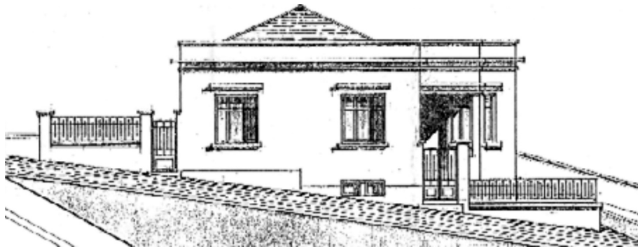
Σχέδιο κατοικίας προσφυγικού συνοικισμού Μπαϊρ Μαχαλά (αρχιτέκτων Ιωάννης Δημητριάδης).

Συνοπτικά η ανοικοδόμηση των συνοικισμών στην πόλη των Σερρών έγινε με τρεις τρόπους: i. με την οργανωμένη δόμηση νέων συνοικισμών από την Πρόνοια (Ταμείο Στέγασης) και την Ε.Α.Π., ii. με τη χορήγηση οικοπέδου με ή χωρίς δάνειο για την ανέγερση κατοικίας, με πρωτοβουλία και ευθύνη του ίδιου του δικαιούχου και iii. με τη σύσταση αστικών συνεταιρισμών, στους οποίους παραχωρήθηκαν οικόπεδα και οικοδομικά δάνεια. Εκτός από την περίπτωση του Μπαϊρ Μαχαλά, όπου οι πρόσφυγες συστεγάσθηκαν με πυροπαθείς γηγενείς, οι συνοικισμοί ήταν αμιγώς προσφυγικοί και αναπτύχθηκαν σε αδόμητες εντός σχεδίου περιοχές, κυρίως στα νότια της πόλης. Στον οικισμό των Αγίων Αναργύρων, που οικοδομήθηκε πρώτος, δεν υπάρχει η έννοια του οικοπέδου, αλλά των πολλαπλών κατοικιών σε ενιαίο χώρο. Στον συνοικισμό Νέας Ιωνίας σε