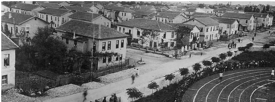
Προσφυγικά σπίτια του Σηροτροφικού Συνοικισμού «Νέα Κιουπλιά».

Ο συνοικισμός δενδροφυτεύτηκε αμέσως με μουριές και η σηροτροφία υπήρξε η βασική απασχόληση για πολλά χρόνια των Μικρασιατών προσφύγων που εγκαταστάθηκαν εκεί. Αντίθετα οι Θρακιώτες πρόσφυγες, που επίσης εγκαταστάθηκαν στον ίδιο συνοικισμό ασχολήθηκαν με γεωργικές εργασίες και μικρεμπόριο. Η σύγκριση του Σηροτροφικού Συνοικισμού «Νέων Κιουπλιών» που έγινε πρώτος με τον Αστικό Σηροτροφικό Συνοικισμό που ακολούθησε ήταν σαφώς υπέρ του δεύτερου: «ούτος (ο συνοικισμός Κιουπλιά) υστερεί μεγάλως του αστικού συνοικισμού, καθόσον εκτίσθη μεν δια χρημάτων της Ε.Α.Π, πλην όμως αι κατοικίαι κα-