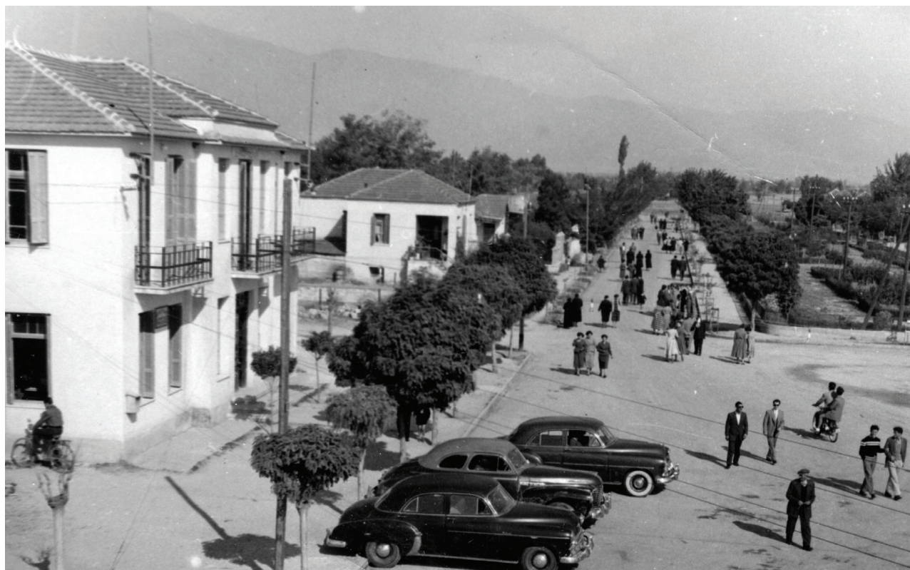
Η πλατεία με το Δημαρχείο. Εντυπωσιακή είναι η εκτεταμένη δενδροφύτευση. Πιθανόν στα μέσα ή τέλη της δεκαετίας του 1950

με πρόεδρο τον έμπορο Κ. Βελιγρατλή, έναν από τους Τζουμαγιώτες που τέθηκαν επικεφαλής μίας από τις αποστολές επιστροφής των ομήρων στην πατρίδα. Το κάθε μέλος είχε υποχρέωση να προκαταβάλει το 20% του κόστους ανέγερσης του καταστήματός του, μόλις ο συνεταιρισμός κατάφερε να εξασφαλίσει τραπεζικό δάνειο για το σύνολο του έργου. Ακολούθησε διανομή των οικοπέδων (Ν. 5077/1931), ενώ τα τυχόν αδιάθετα οικόπεδα περιέρχονταν στην ιδιοκτησία της Κοινότητας, η οποία μπορούσε να τα εκποιεί έναντι χρηματικού ανταλλάγματος. Όμως, μετά την πτώση της κυβέρνησης των Φιλελευθέρων το 1932, ο Συνεταιρισμός δεν κατάφερε να εξασφαλίσει δάνειο για τη συνολική ανοικοδόμηση. Εν τω μεταξύ ένας τρίτος νόμος (Ν. 6403/1934) ακύρωσε όλες τις πράξεις που είχαν γίνει από την κοινότητα για την πώληση οικοπέδων και επέβαλε να διατεθούν και αυτά στον Οικοδομικό Συνεταιρισμό. Ακόμη, προέβλεπε ότι η σύνθεση του Συνεταιρισμού θα άλλαζε, καθώς πλέον αυτός υποχρεωνόταν να περιλάβει στις τάξεις του όλους τους ασχολούμενους με το εμπόριο στην πόλη καθώς και τους άλλοτε οικοπεδούχους της κεντρικής περιοχής, επαγγελματίες ή