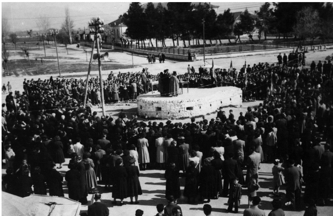
Δοξολογία στην πλατεία της Ηράκλειας, γύρω στο 1950. Το πολυβόλαιο, εν είδει εξέδρας, δηλώνει άλλη εποχή! Στο βάθος διακρίνεται το Δημοτικό Σχολείο, ενώ στα αριστερά του το πάρκο είναι υπό διαμόρφωση

ρίπου 300 ομοιόμορφες ισόγειες κατοικίες 8 σε δύο τύπους, με αετώματα, ελαφρά καμπυλωμένα υπέρθυρα και κομψές περιφράξεις, σχέδια που θυμίζουν κατοικίες σε περιοχές οργανωμένης δόμησης στη Γαλλία (social housing). Παραμένει άγνωστη η προέλευση και ο τρόπος επιλογής των αρχιτεκτονικών σχεδίων αυτών των κατοικιών. Ίσως ήταν κληρονομιά από την παλιά Υπηρεσία Ανοικοδομήσεως Ανατολικής Μακεδονίας, ίσως όχι. Είναι γεγονός, πάντως, ότι μορφολογικά παραμένουν μοναδικές. Διαφέρουν από τα αγροτικά και προσφυγικά σπίτια του νομού Σερρών, αλλά και της υπόλοιπης Ελλάδας και μεταφέρουν ένα άρωμα κεντροευρωπαϊκής κηπούπολης. Η ανοικοδόμηση των οικιών έγινε στο εκπληκτικό διάστημα των έξι μηνών (Μάιος-Νοέμβριος 1930). Η