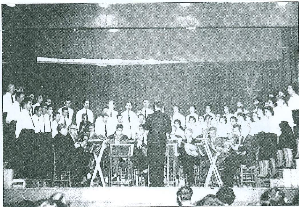
22.3.1961. Συναυλία αφιερωμένη στον Wagner.