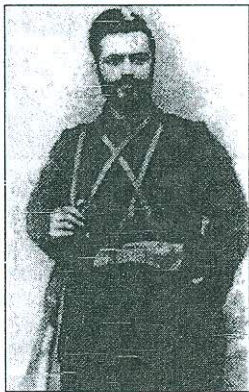
Ὁ καπετάν Δούκας. Ἐδρασε στὴν περιοχὴ Ζίχνας καὶ Παγγαίου.

Στό δεύτερο, στό γενικό ἀρχηγεῖο τῆς Νιγρίτας, μέ ἔδρα τὸ Χουμνικό καὶ τὸ Ζερβοχώρι, ὑπὸ τὴν ἀρχηγία τοῦ Ἀλέξανδρου Εὐρυσιώτη ἢ Αἰδωλιώτη, δροῦν ὁ Γκούρμης, ὁ Καράπαπας, ὁ ἥρωικός ἱερέας τῆς Σακάφτσας (Λειβαδοχωρίου) Παπαπασχάλης, γνωστός καὶ ὡς Καπετάν Ἀνδρουῦτσος, ὁ καπετάν Παγκλῆς κ.ἄ. Ἰδιαίτερα ὁ τελευταῖος στάθηκε ὁ ἄμεσος τιμωρὸς οἰουδήποτε θά τολμοῦσε ἐγκληματικὴ πράξη ἐναντίον Ἑλλήνων καὶ ματαίωσε κάθε ἀπόπειρα βουλγαρικῆς διείσδυσης στὴ Χαλκιδικὴ καὶ στό Ἅγιο Ὅρος.