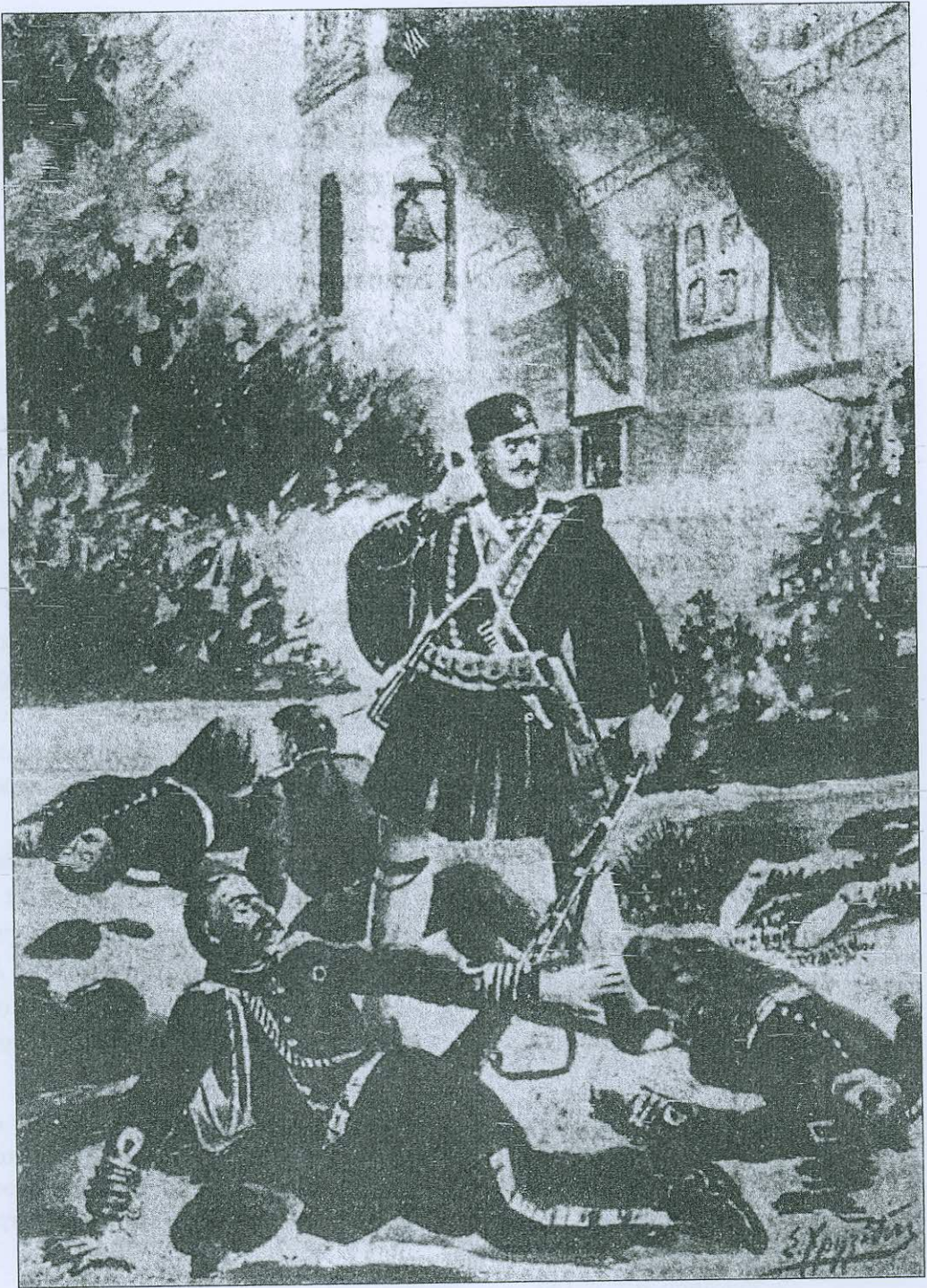
Η αυτοκρατορία του Καπετάν Μητρούση, όπως αποδόθηκε από τον λαϊκό καλλιτέχνη Σ. Χρησιδίδη σε φυλλάδιο της εποχής.