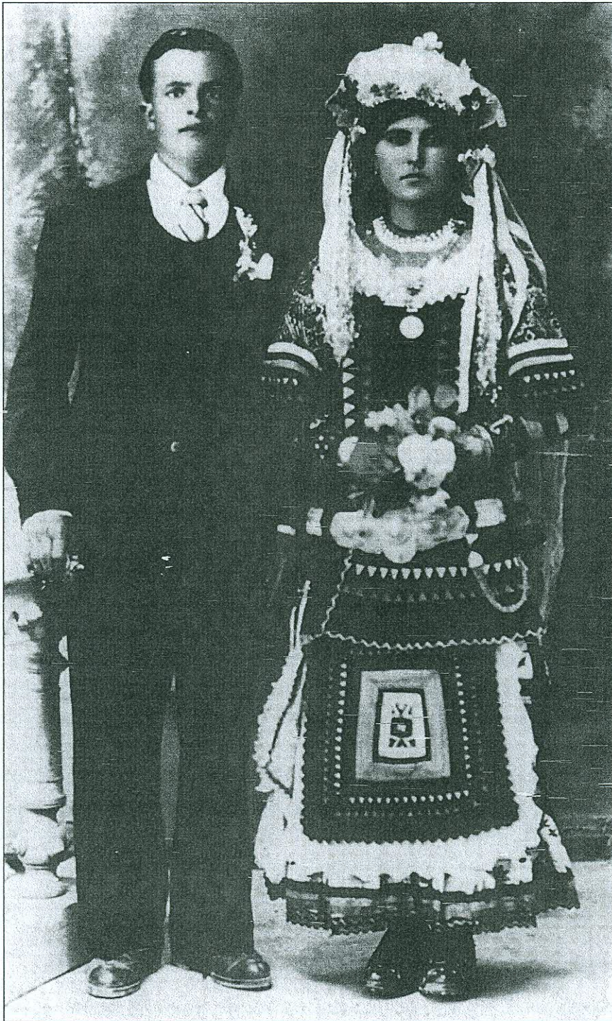
Φωτογραφία νυφικού ζευγαριού τοῦ τέλους τῆς δεκαετίας τοῦ '40. Ἡ νύφη διατηρεῖ τὴν παραδοσιακὴ φορεσιά, ἐνῶ ὁ ἄνδρας ἔχει φορέσει τὴν εὐρωπαϊκὴ.