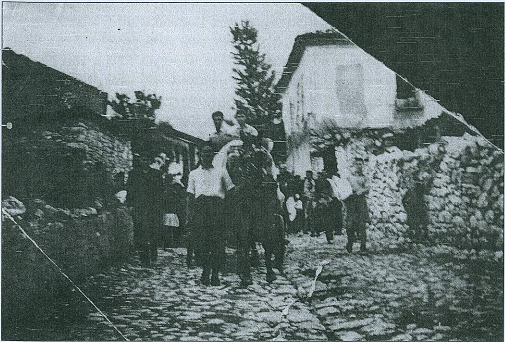
Ἡ μεταφορά τῆς προίκας μέ κάρο (ἐφθαρμένη φωτογρ. τοῦ 1950).