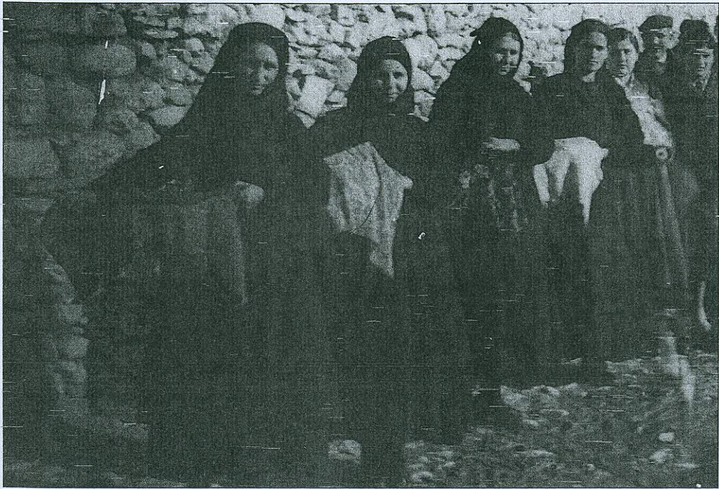
Τά σινιά (φωτογρ. τοῦ 1961).