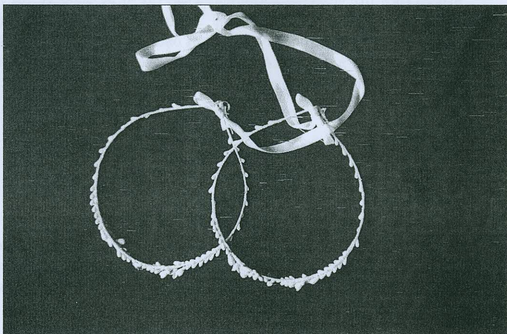
Σύγχρονα στέφανα γάμου.