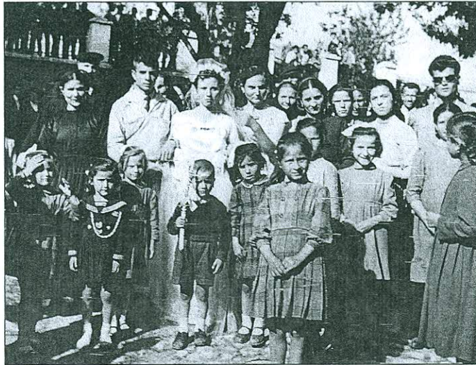
Ἀναμνηστική φωτογραφία στό προαύλιο τῆς ἐκκλησίας πρῖν ἡ νύφη μπεῖ γιά τή στέψη (Νέο Σούλι, 1957).

Τώρα ὅλα εἶναι ἔτοιμα γιά τήν ἐκκλησία. Ἡ νύφη, πρῖν ἀφήσει τό σπίτι της, ἔκανε τρεῖς «μετάνοιες», ἔκανε τό σταυρό της καί κατέβαινε τά σκαλιά. Στήν ἐξώπορτα γύριζε κατά τήν ἀνατολή, ἔκανε πάλι τό σταυρό της καί ἡ γαμήλια πομπή ξεκινούσε γιά τήν ἐκκλησία. Μπροστά πήγαιναν οἱ ὀργανοπαῖκτες, ἀκολουθοῦσε ὁ γαμπρός καί ὁ κουμπάρος καί σέ μικρή ἀπόσταση, σεμνή καί χαμηλοβλεποῦσα, ἡ νύφη. Πίσω ἀκολουθοῦσε ὅλο σχεδόν τό χωριό.