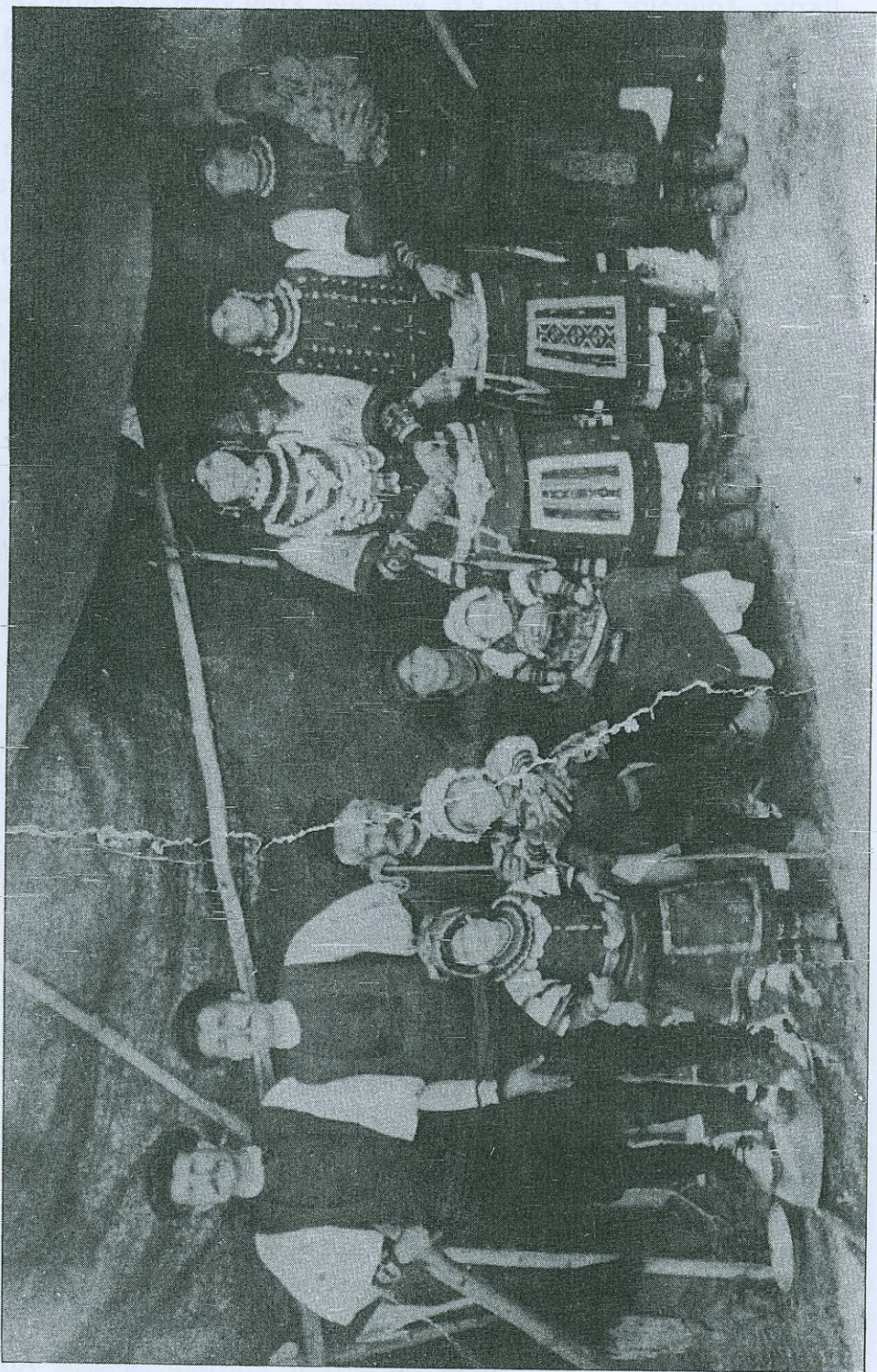
ΟΙΚΟΓΕΝΕΙΑ ΣΑΡΑΚΑΤΣΑΝΩΝ ΣΕ ΤΣΙΑΤΟΥΡΑ (1920)