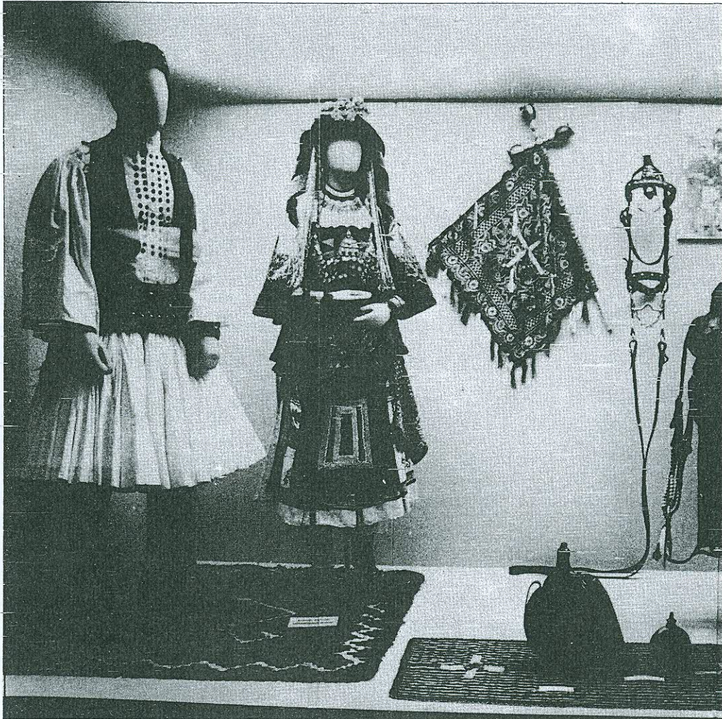
ΠΡΟΘΗΚΗ ΓΑΜΟΥ (ΤΜΗΜΑ)