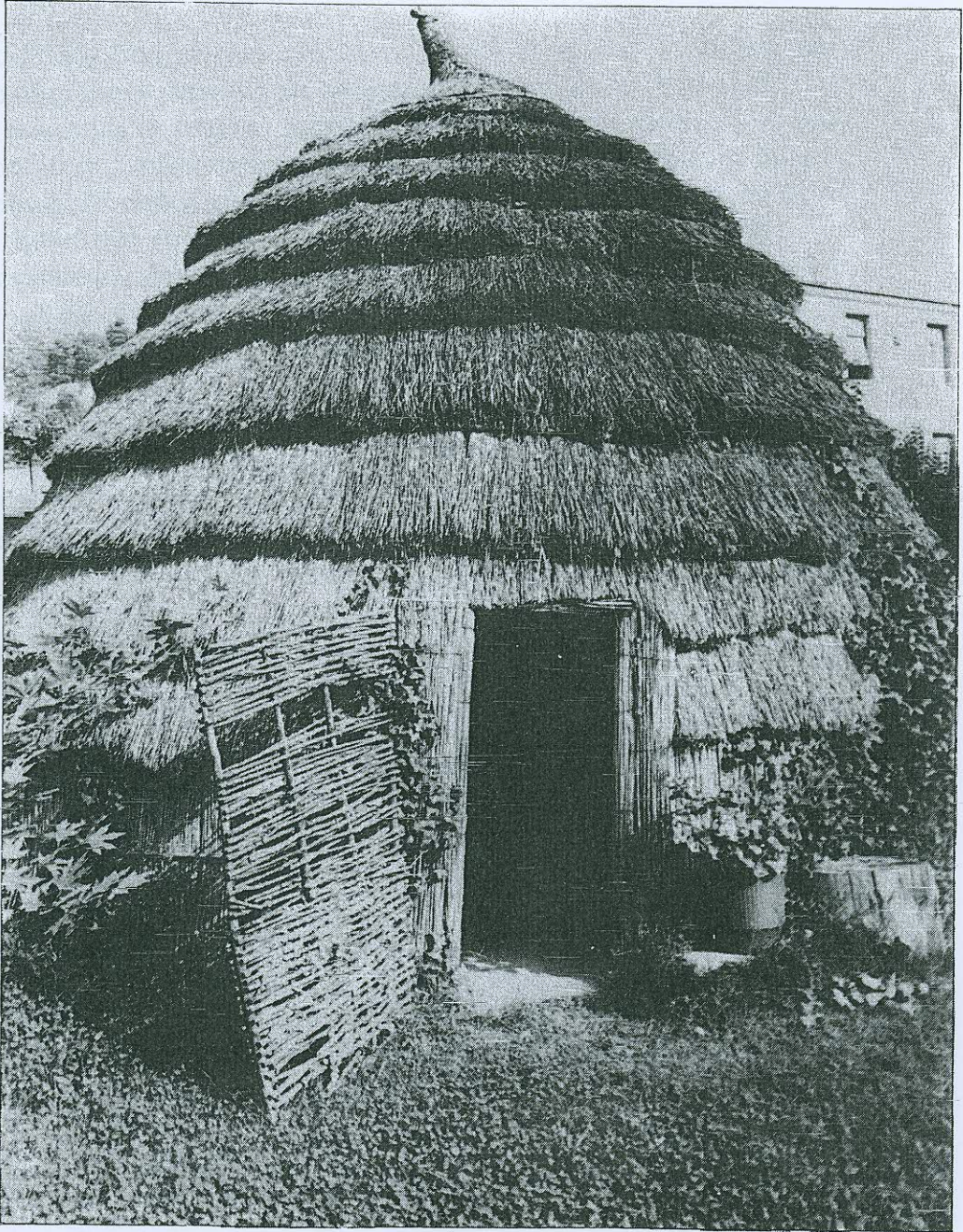
Η ΜΕΓΑΛΗ ΚΑΛΥΒΑ (ΚΟΝΑΚΙ)