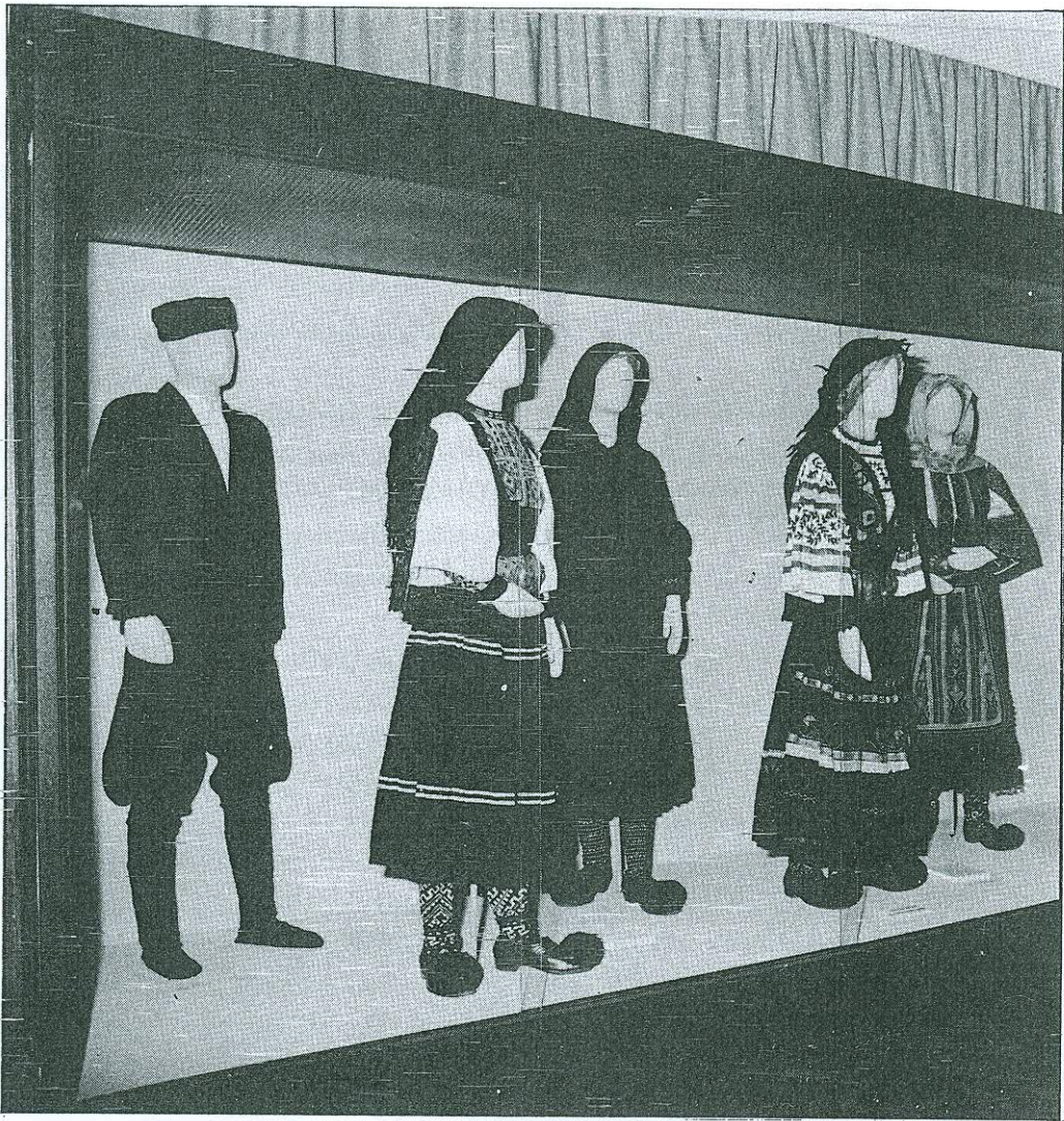
ΑΙΘΟΥΣΑ ΕΝΔΥΜΑΣΙΩΝ (ΤΜΗΜΑ)