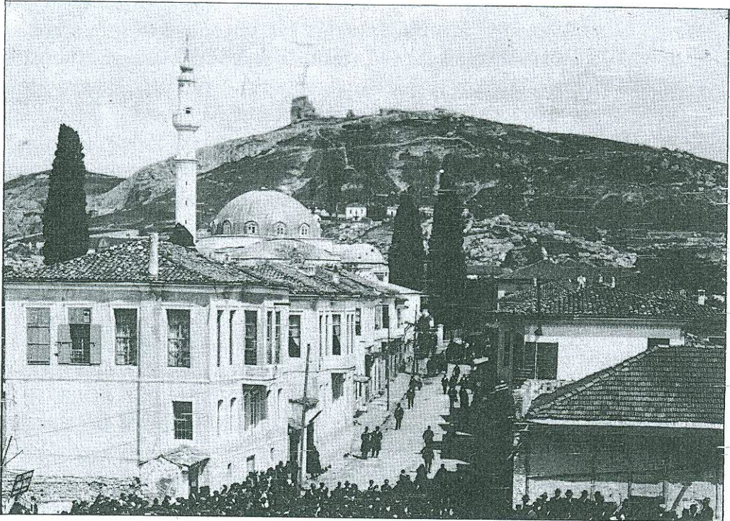
Τμήμα τῆς παλαιᾶς κεντρικῆς ὁδοῦ τῶν Σερρῶν (ἢ σημερινὴ λεωφόρος Μερραρχίας), ποὺ διασώθηκε ἀπὸ τὴν πυρπόληση τοῦ 1913. Ἡ πρώτη ἀριστερὰ γωνιαία οἰκία, μετὰ τὴν καταστροφὴ τῆς πόλεως, χρησιμοποιήθηκε ὡς μητροπολιτικὴ κατοικία καὶ γιὰ γραφεῖα τῆς Μητροπόλεως (ἀρχεῖο Π. Πέννα).