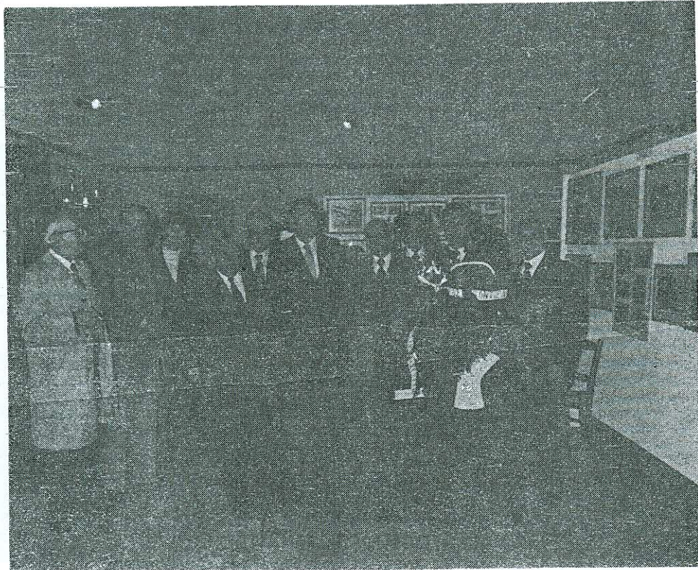
Ἀναμνηστικὴ φωτογραφία στὴν αἴθουσα ἐκθέσεων τοῦ «Ὀρφέα»

Ἡ ἀπομάκρυνσή του ὅμως ἀπὸ τὶς Σέρρες μὲ τὴν ὁποία τὸν συνέδεαν ὅλες αἱ ἐντυσώσεις τῶν παιδικῶν του χρόνων, καὶ ἡ ἀπέραντη πρὸς αὐτὴν ἀγάπη του, τὸν ἔκαμε ἀθεράπευτα νοσταλγὸ τῆς γενέτειράς του. Τοῦτο στάθηκε ἀφορμὴ στὸ νὰ ἐπιδοθῆ μὲ ἀληθινὸ πάθος σὲ ἱστορικές ἔρευνες καὶ μελέτες γι'αυτὴν, ἀλλὰ καὶ στὴν ἐνεργὸ πολιτικὴ ν' ἀναμιχθῆ,