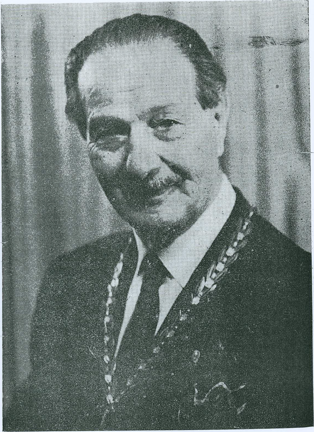
ΟΥΜΒΕΡΤΟΣ ΑΡΓΥΡΟΣ (1882 - 1963)