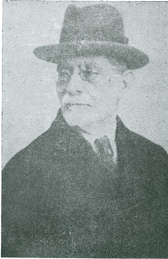
ΑΘΑΝΑΣΙΟΣ ΑΡΓΥΡΟΣ (1859—1945)