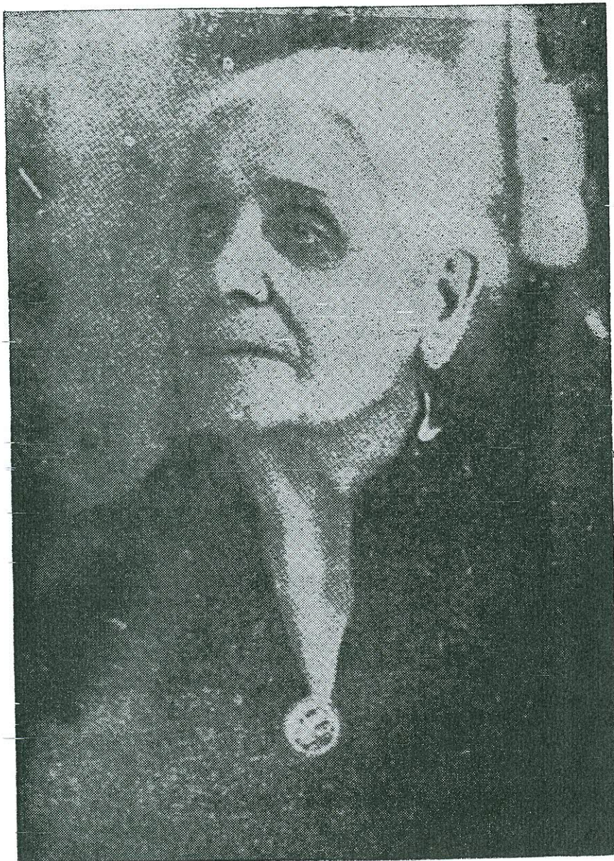
ANNA ΤΡΙΑΝΤΑΦΥΛΛΙΔΟΥ (1867—1960)