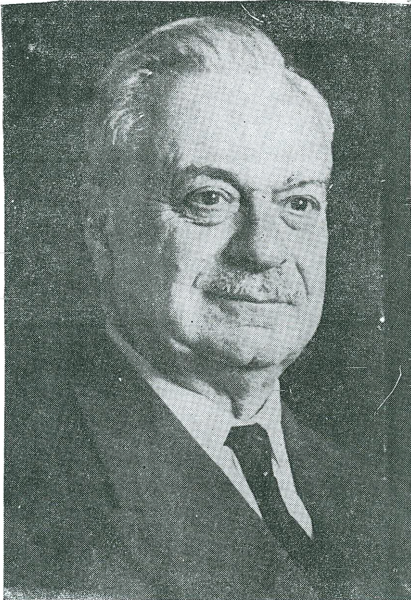
ΔΗΜΗΤΡΙΟΣ ΧΟΝΔΡΟΣ (1882—1962)