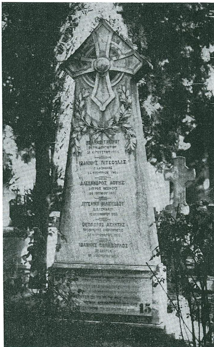
Τὸ ἐν Θεσσαλονίκῃ μνημεῖον τοῦ Ἰωάννου Παπάζογλου