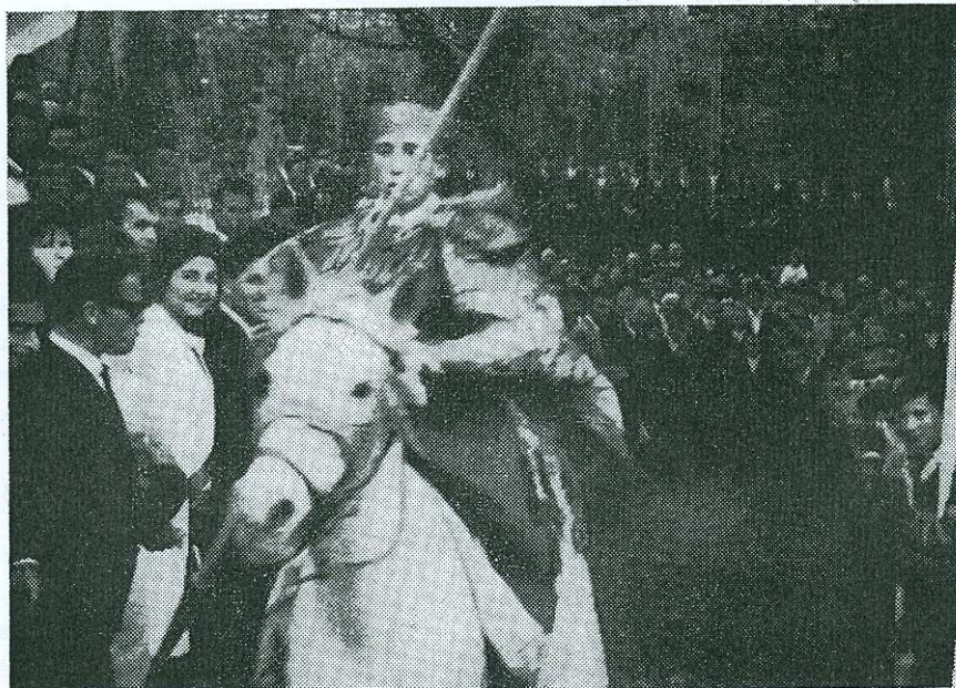
Εἰκ. 9. Ὁ ἐφιππος νέος κατευθυνόμενος εἰς τὴν πηγὴν.