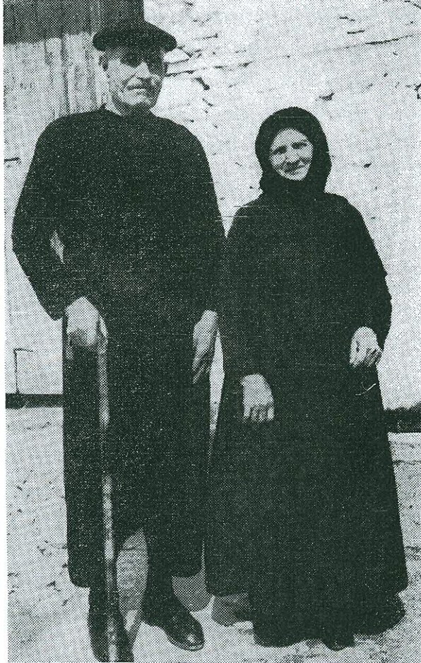
Εἰκ. 2. Ζεῦγος κατοίκων Ν. Σουλίου μὲ τοπικὴν ἐνδυμασίαν.

Μετὰ τὴν τέλει τῆς θείας λειτουργίας εἰς τὴν κεντρικὴν ἐκκλησίαν, πρὸς τιμὴν τῆς Κοιμήσεως τῆς Θεοτόκου, οἱ ἱερεῖς καὶ τὸ ἐκκλησίασμα με-