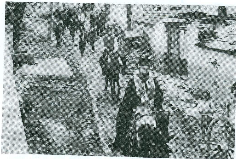
Εἰκ. 5. Ἡ ἐπιστροφή τῆς πομπῆς.