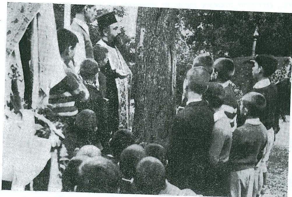
Εἰκ. 4. «Ἰψωμα» ἐπὶ δένδρου.