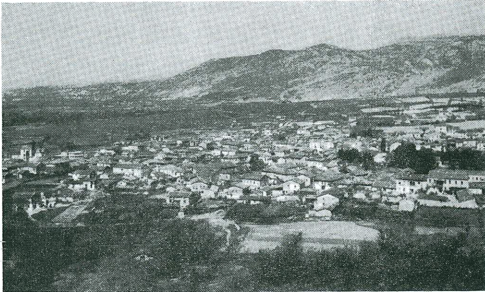
Εἰκ. 1. Νέον Σούλι.

Τὸ χωριὸν τοῦτο (εἰκ. 1), ἀνήκον εἰς τὰ καλούμενα Δαρνακοχώρια 1) , εἶναι ἕκ τῶν μεγαλυτέρων εἰς πληθυσμὸν καὶ ἀρχαιοτέρων τῆς