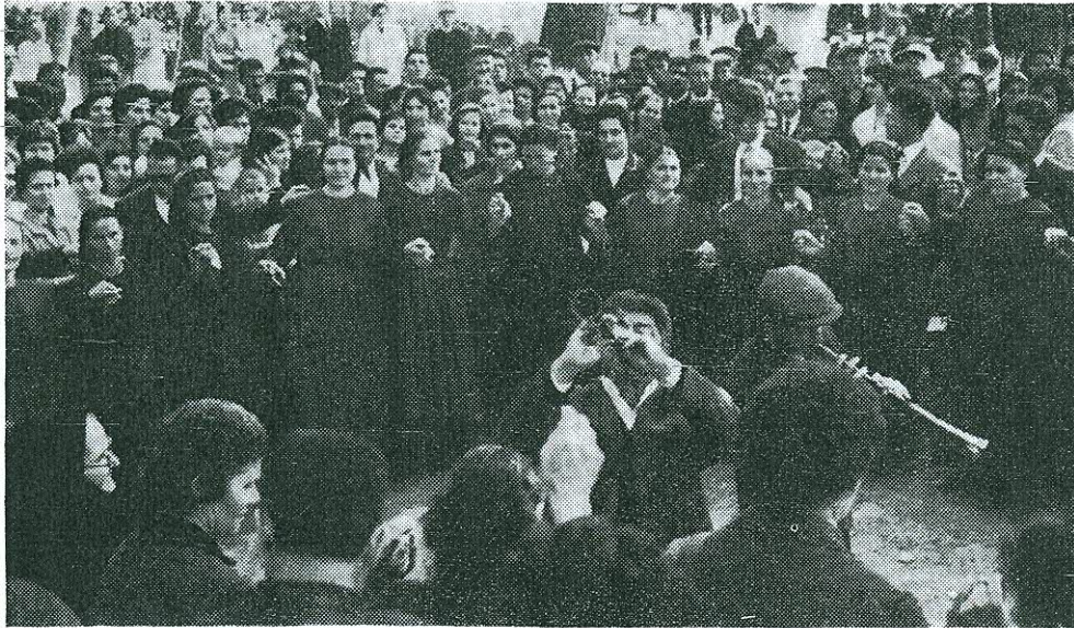
Εἰκ. 6. Ἐκτελέσεις τοπικῶν χορῶν.

Τέλος ὁ ὅλος ἑορτασμός ἔληξε διὰ τῆς διεξαγωγῆς ἀγωνισμάτων, ἀγῶ-