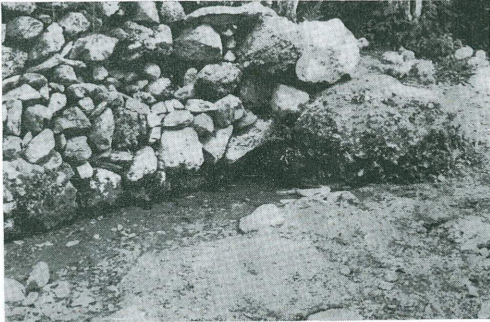
Εἰκ. 10. Ἡ πηγὴ εἰς τὴν ὁποίαν τοποθετεῖται ὁ φόνος τοῦ δράκοντος.

Οὕτως ἡ πηγὴ (εἰκ. 10) παρὰ τὸ παρεκκλήσιον τοῦ Ἁγίου Γεωργίου, συνδέεται μὲ παράδοσιν, συμφώνως πρὸς τὴν ὁποίαν : « ἦτανε μιὰ βρύση 1) κεῖ πέρα κ' ἔτρεχε τὸ νερό. Κι ὁ Δράκος ἦβγε [=ἔβγαινε] καὶ τὸ σταματοῦσε τὸ νερό. Τὸ σταματοῦσε καὶ ἂν ἔταζαν καμμιά κόρη τὴν ἔτρωγε καὶ τὸ ἀπολοῦσε τὸ νερό. Μιὰ μέρα πᾶνε μιὰ κόρη. Τὴν στολίσαν, τὴν ται-