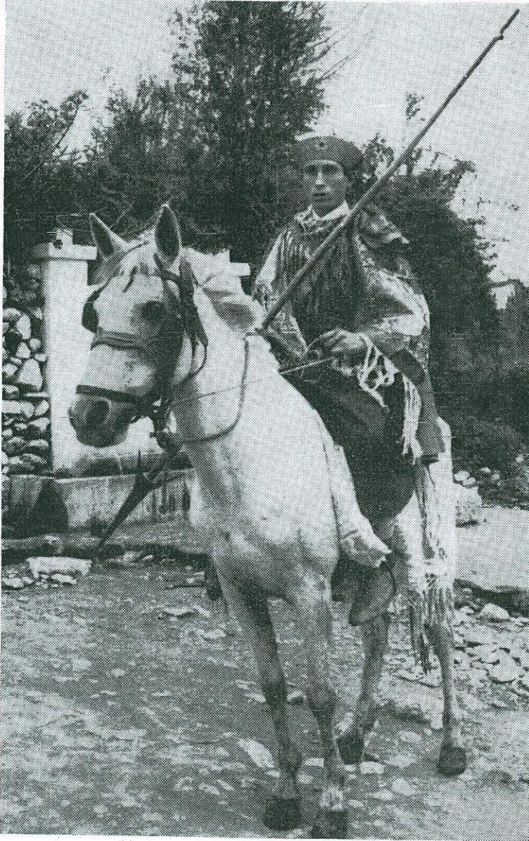
Εἰκ. 7. Νέος ἔφιππος παριστάνων τὸν Ἅγιον Γεώργιον.

Ἐκ τῶν τελετουργικῶν τούτων πράξεων, ἡ πρώτη, δηλ. ἡ κύκλω λιτάνευσις, ἀποσκοπεῖ, συμφώνως πρὸς τὴν πίστιν τοῦ λαοῦ, εἰς τὴν ἐπιτυχίαν τῆς γεωργικῆς παραγωγῆς διὰ τῆς ἀποκρούσεως παντὸς κακοῦ καὶ κυρίως τῆς πτώσεως χαλάζης.