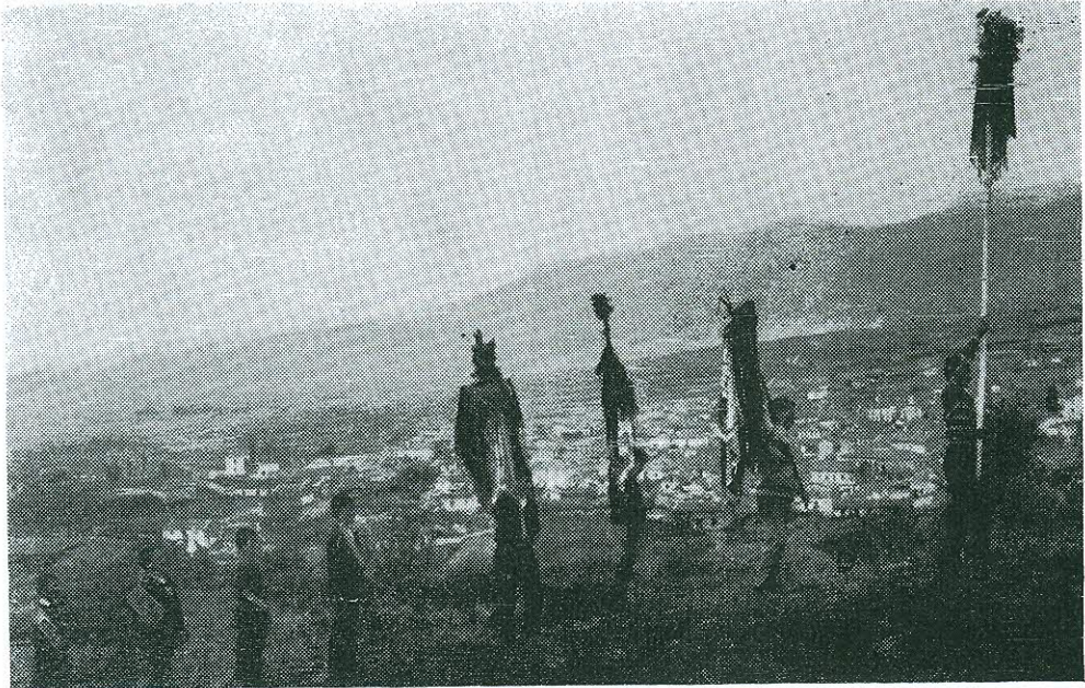
Εἰκ. 3. Ἡ λιτανευτικὴ πομπή (τμήμα).

Ἡ κυκλικὴ λιτανεῖα αὕτη κατέληξεν εἰς τὸ ἐπὶ ὑψώματος, ἔξωθεν τοῦ χωρίου, παρεκκλήσιον τοῦ προφήτου Ἡλιοῦ, περὶ τὸ ὁποῖον ἐγένετο τρεῖς περιφορὰ τῶν εἰκόνων, εἶτα δὲ καὶ ὑψωμα ἐπὶ δένδρου, ὡς ἀνωτέρω.