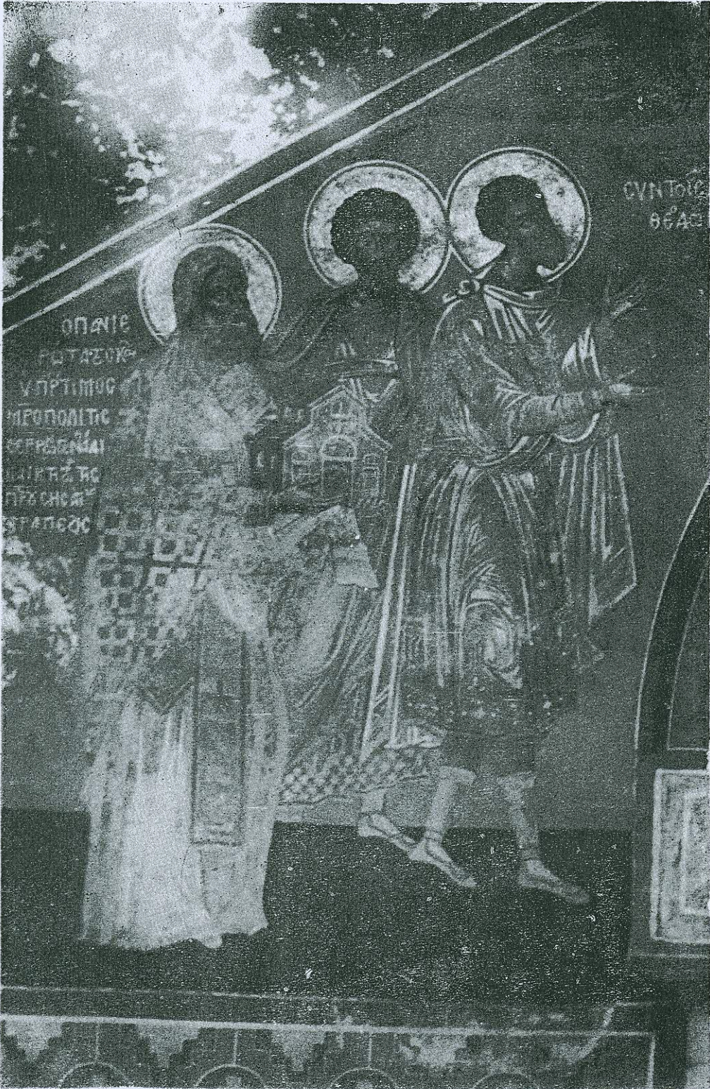
Προσωπογραφία τοῦ Μητροπολίτου Σεργῶν Γενναδίου Τοιχογραφία εἰς τὴν τράπεζαν τῆς Μ. Λαύρας Ἁγίου Ὁρους