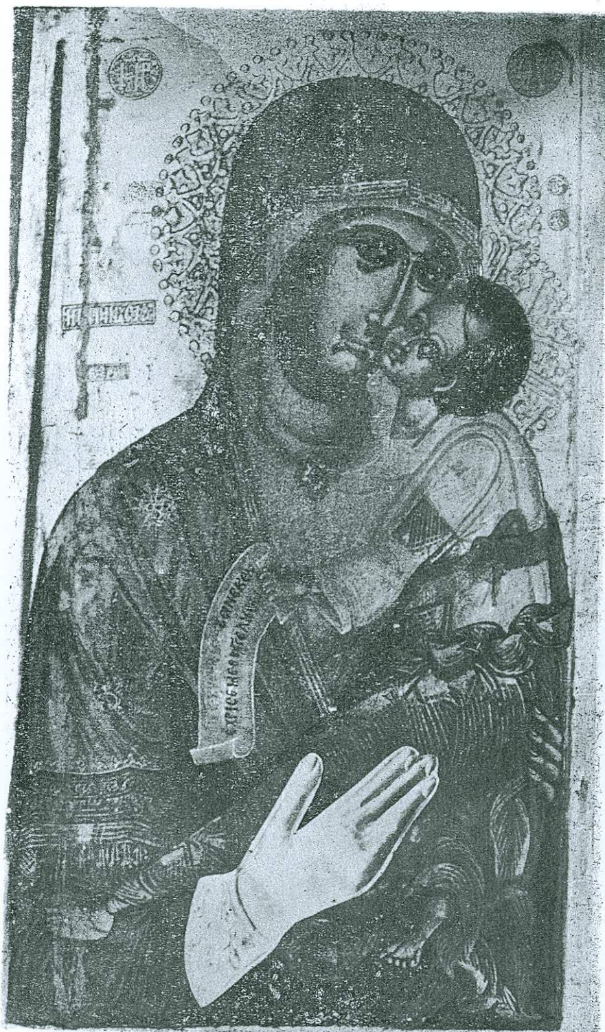
Εικών 2. τῆς Θεοτόκου εἰς τὸν ναὸν τοῦ Ἁγ. Γεωργίου Κρουνερίτου Σεργῶν