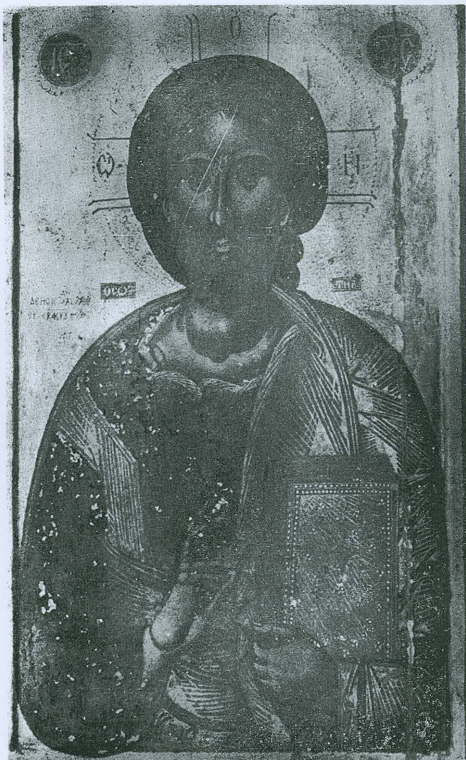
Εἰκὼν 1. τοῦ Ἰησοῦ εἰς τὸν ναὸν τοῦ Ἁγίου Γεωργίου Κρουνερίτου Σεργῶν