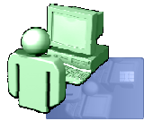
Cardisoft eUniversity Platform