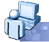
GUnet & ΕΔΕΤ & Ερμής