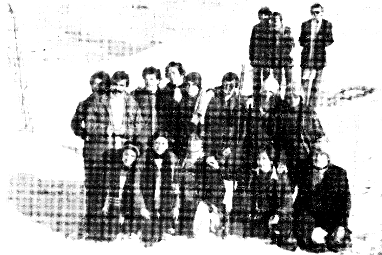
Ἀπὸ τὴν ἐκδρομὴ στὸ Σέλι.

Τὸ Δ.Σ. καλεῖ ὅλα τὰ μέλη, τῆς Ἑνωσῆς Φοιτητῶν Σπουδαστῶν Ν. Σερρῶν πού ἐνδιαφέρονται γιὰ τὸ θέατρο νὰ πλακισώσουν ἢ νὰ ἐνισχύσουν μὲ κάθε δυνατό μέσο τὸ θεατρικὸ τμήμα τοῦ «Ὀρφέα».