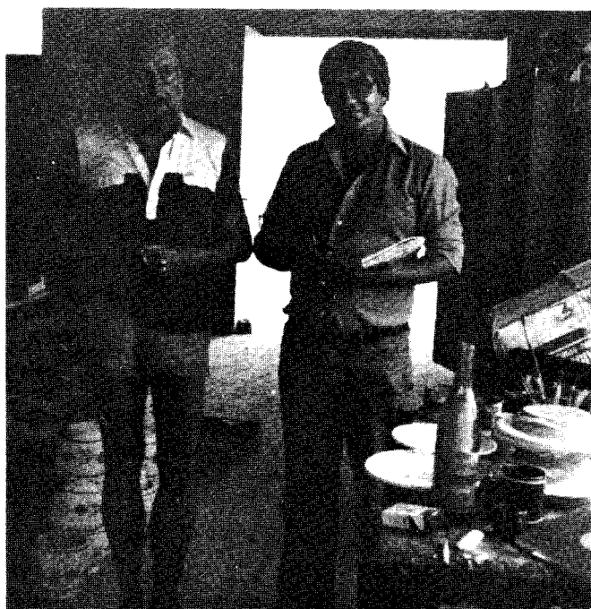
Ο Γιάννης Ρίτσος μαζί με τό συντάκτη μας Γιώργο Μπίλιο, στό εργαστήρι όπου ό ποιητής άσχολούδνταν μέ τήν άγρειοπλιστική τό περισμένο καλοκαίρι στό νησί του.